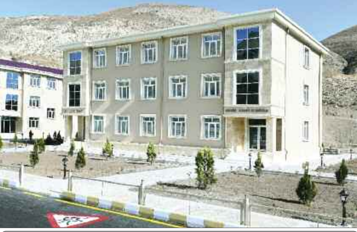
Babək rayonunun Aşağı Buzqov kəndində həkim ambulatoriyası