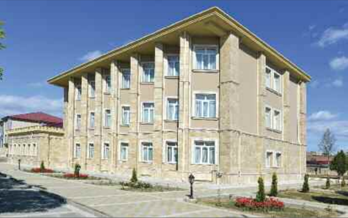
Naxçıvan Muxtar Respublikası Avtomobil Yolları Dövlət Agentliyinin inzibati binası