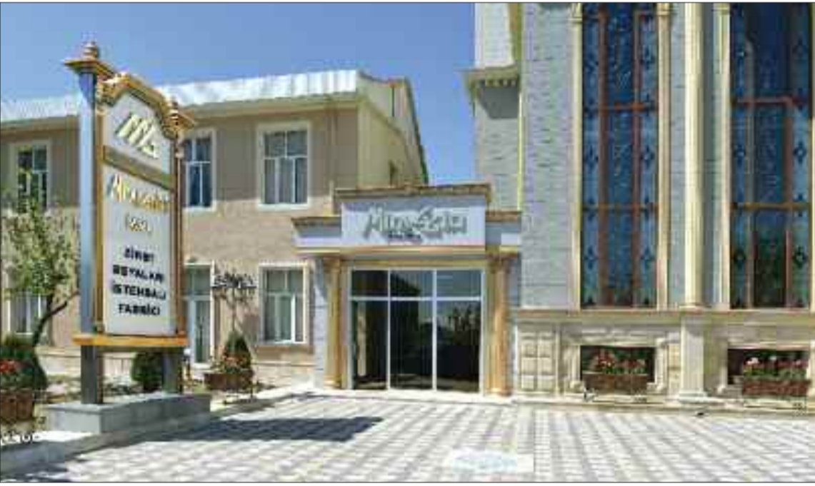
Naxçıvan şəhərində zینət əşyaları hazırlayan fabrik