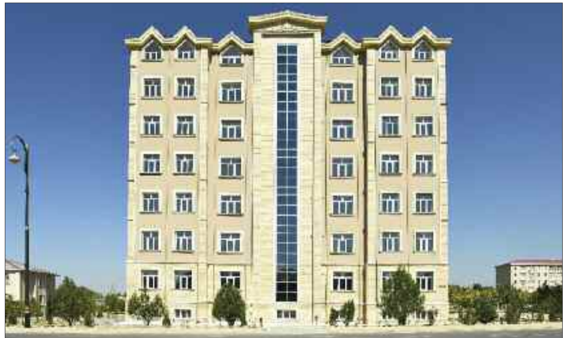
Babək rayonunun Babək qəsəbəsində 28 mənzilli yeni yaşayış binası