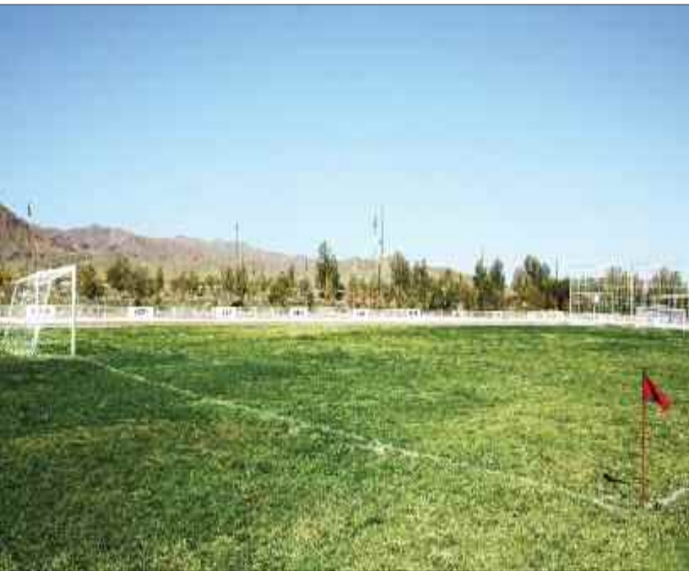
Culfa rayonunda mərkəzi stadion