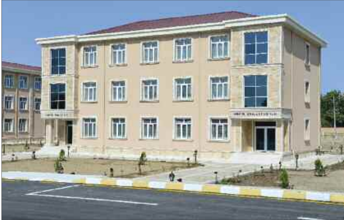
Şərur rayonunun İbadulla kəndində həkim ambulatoriyası