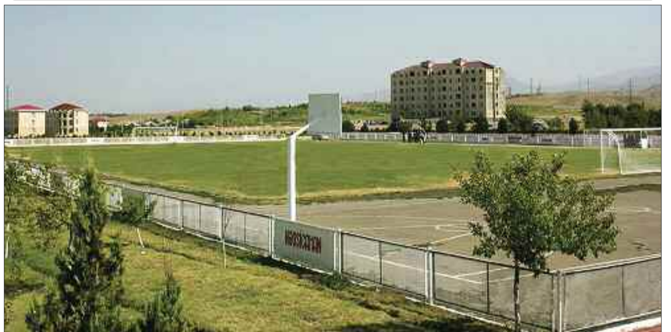
Kəngərli rayonunda mərkəzi stadion