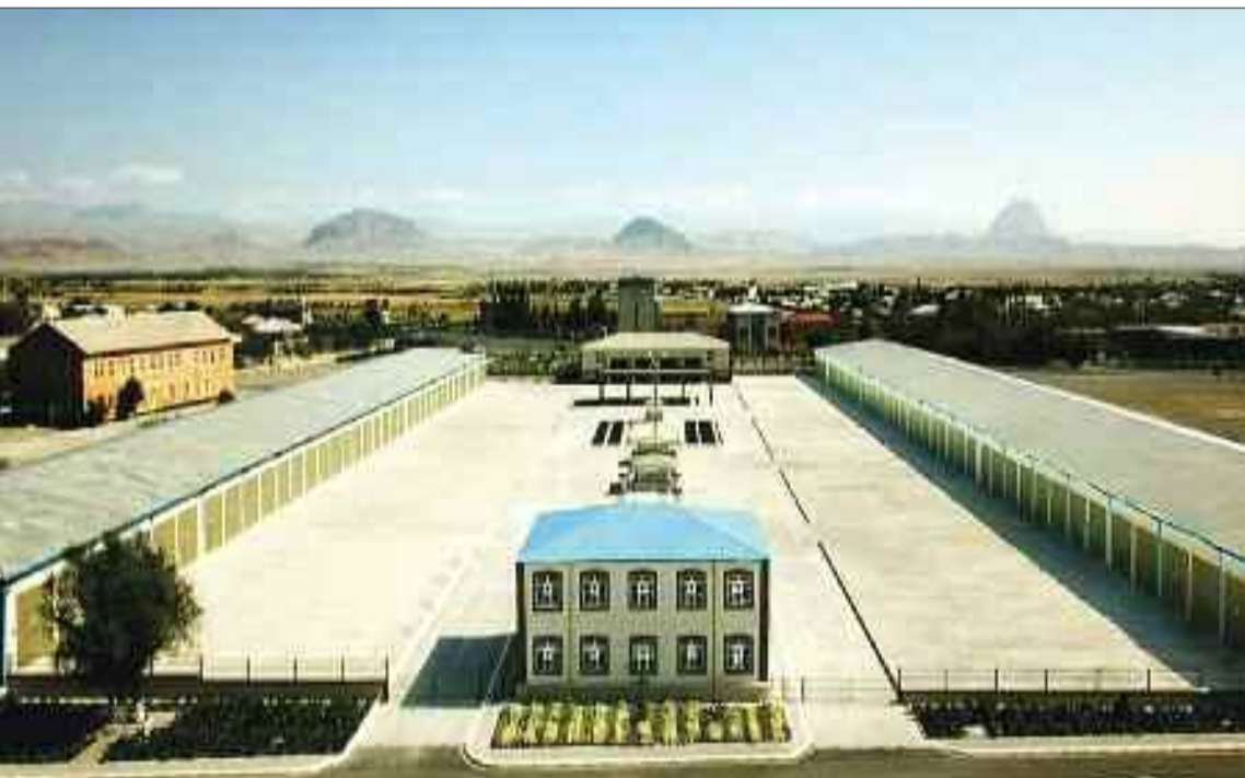
Əlahiddə Ümumqoşun Ordunun yeni hərbi hissəsi