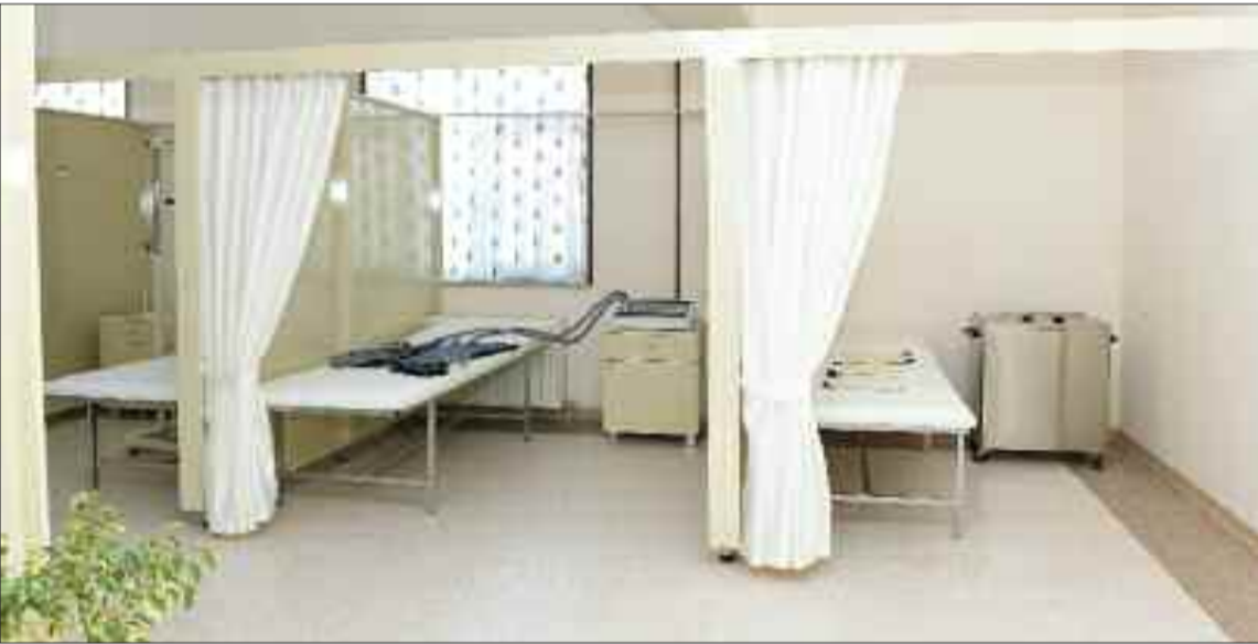
Naxçıvan Əlillərin Bərpa Mərkəzinə və Naxçıvan Uşaq Bərpa Mərkəzinə verilmiş yeni tibbi avadanlıqlar