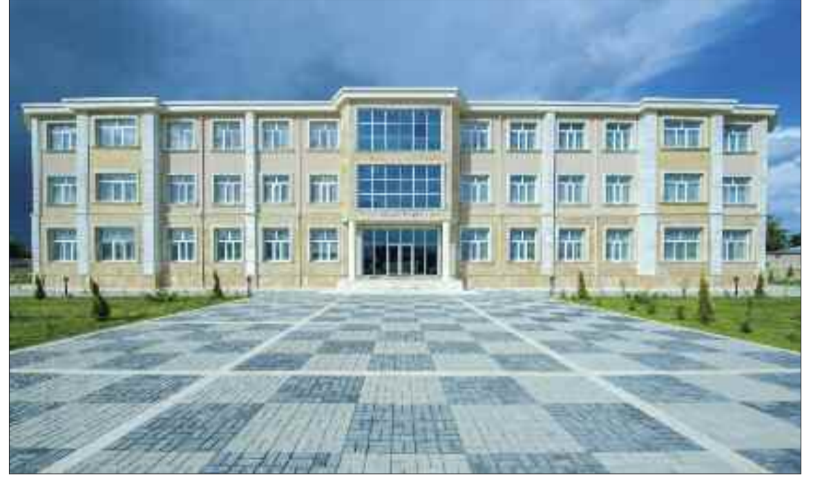
Naxçivan şəhərinin Qaraxanbəyli kəndində 480 şagird yerlik 6 nömrəli tam orta məktəb