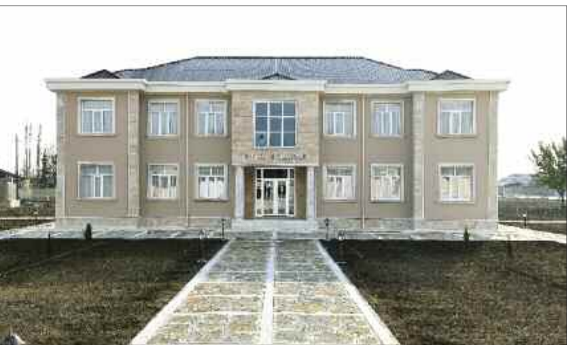
Şərur rayonu Kosacan Kənd Mərkəzi