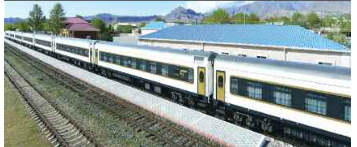
Muxtar respublikanın dəmir yolu təsərrüfatına gətirilmiş yeni sənişin vaqonları