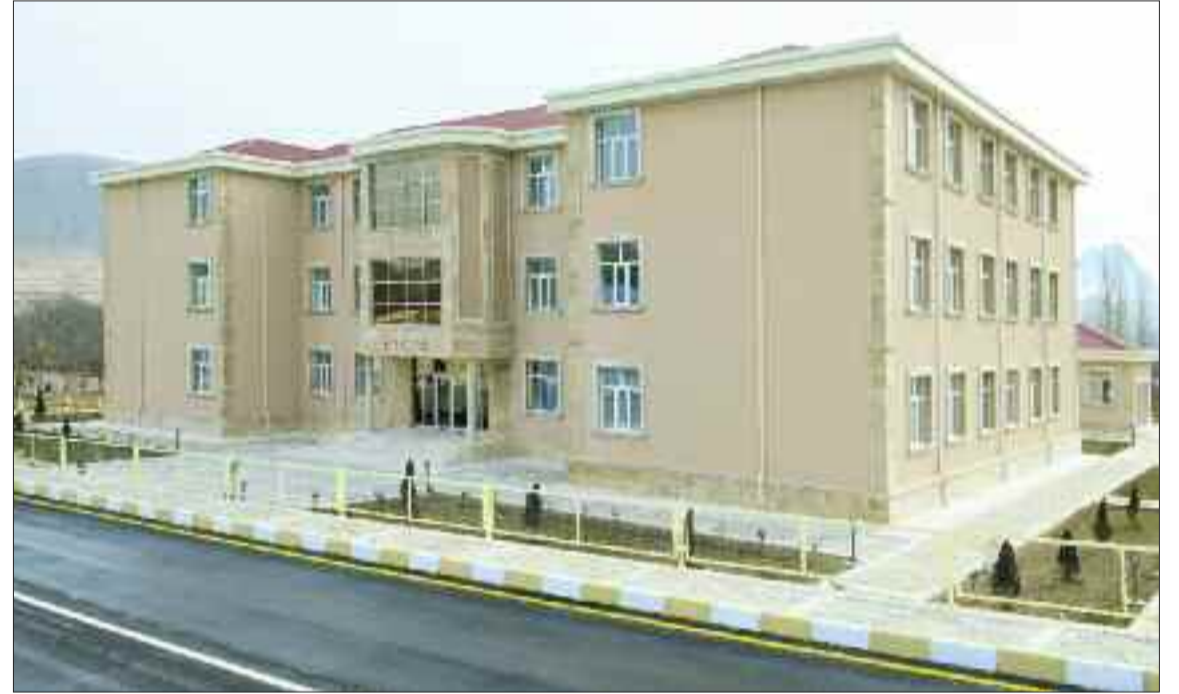
Culfa rayonunun Qazançı kəndində 216 şagird yerlik tam orta məktəb