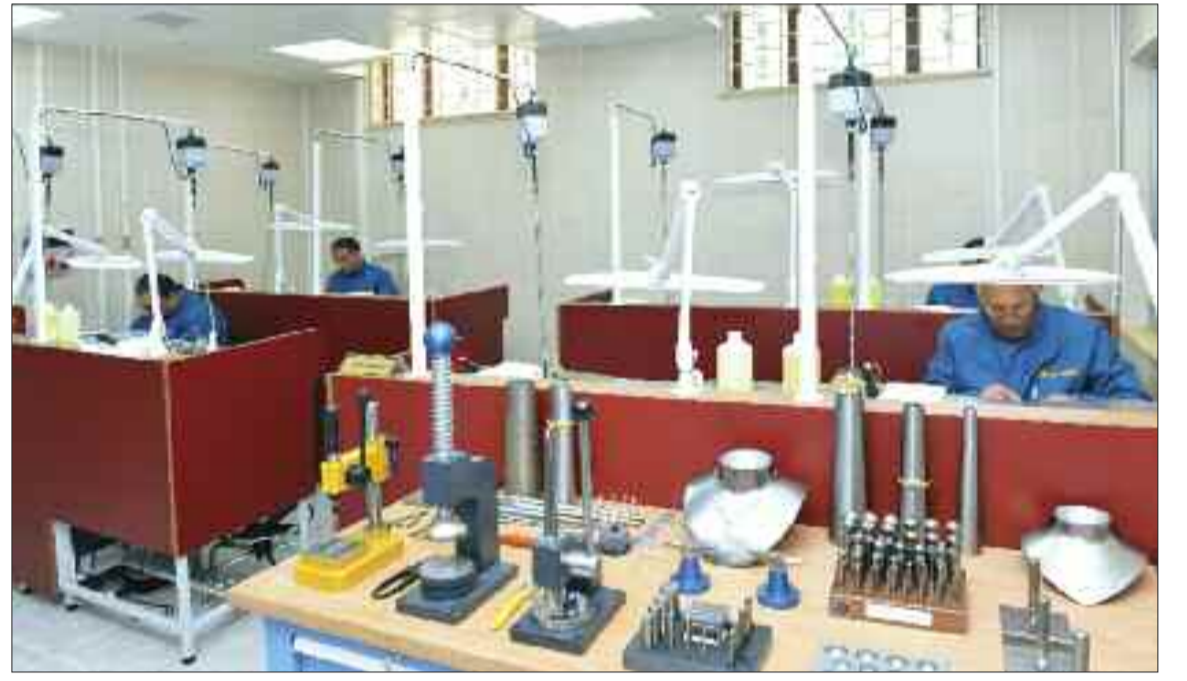
Naxçıvan şəhərində zینət əşyaları hazırlayan fabrikdə iş prosesi