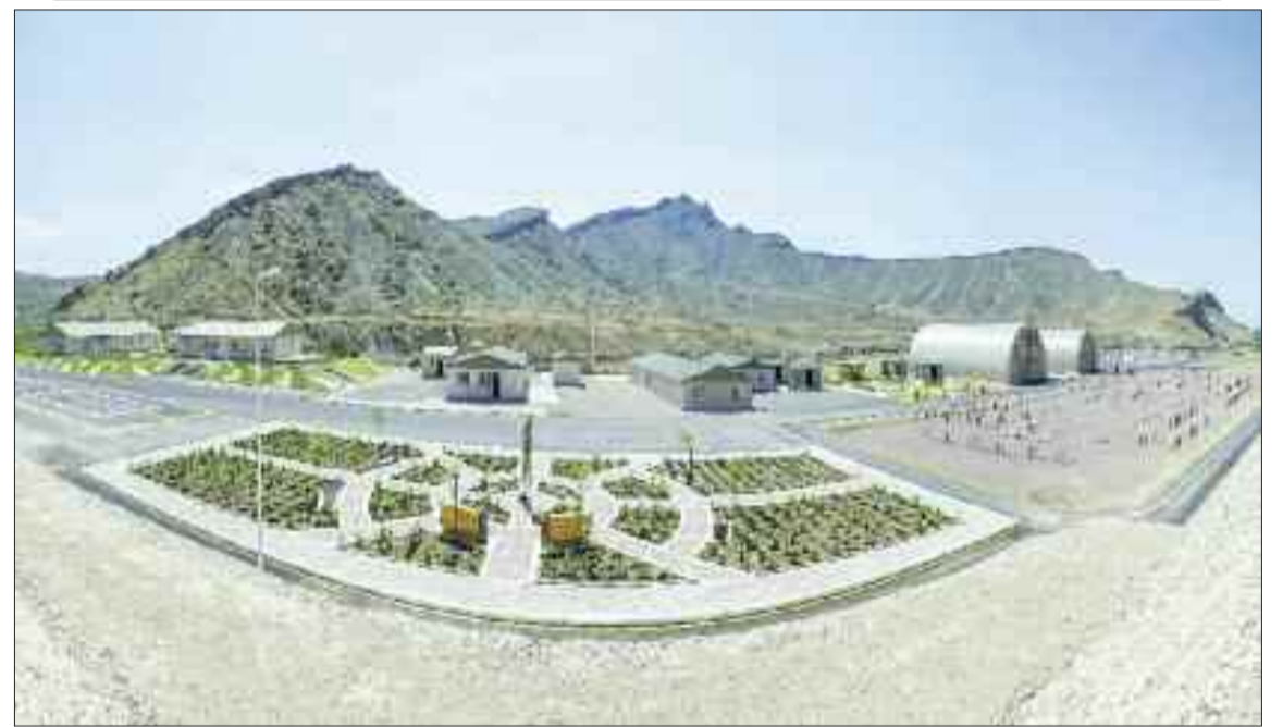
Əlahiddə Ümumqoşun Ordunun hərbi hissəsi üçün yeni xidmət və yaşayış kompleksi