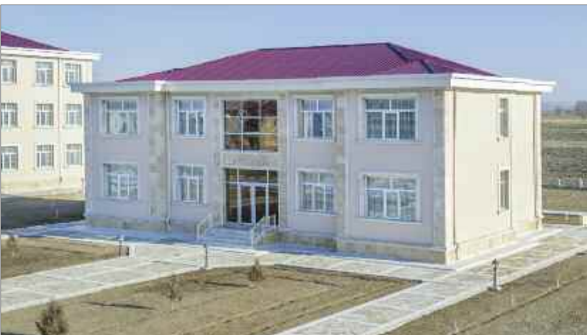
Şərur rayonunun Ərəbyengicə kəndində həkim ambulatoriyası