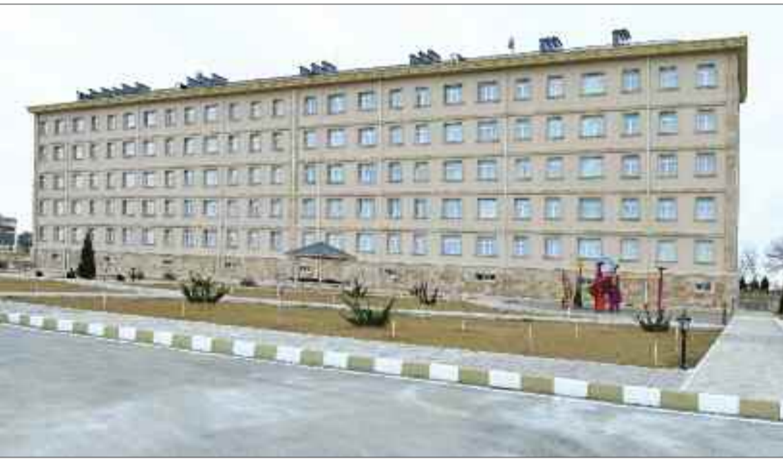
"Naxçıvan" Əlahiddə Sərhəd Diviziyasının hərbi şəhərciyində xidməti yaşayış binası