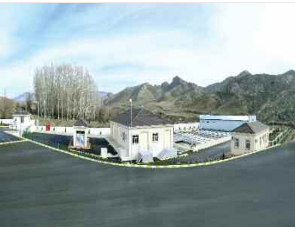
Şahbuz şəhərində təmizləyici qurğular sistemi