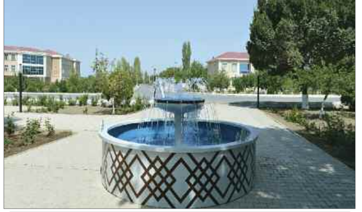
Şərur rayonunun Yengicə kəndində içməli su şəbəkəsi