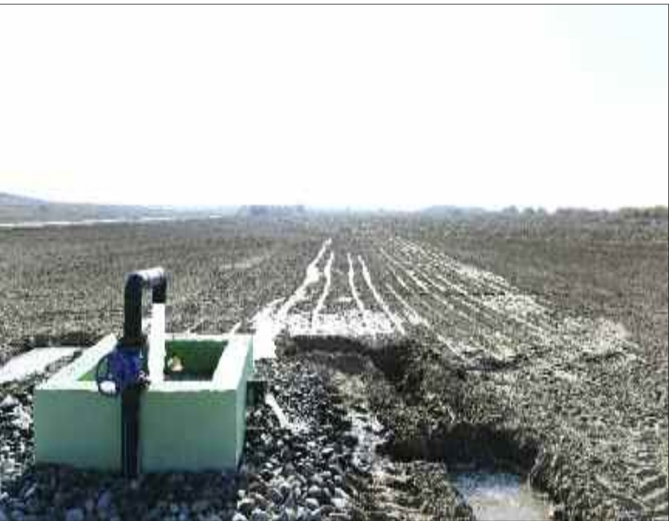
Kəngərli rayonunda qapalı suvarma şəbəkəsi