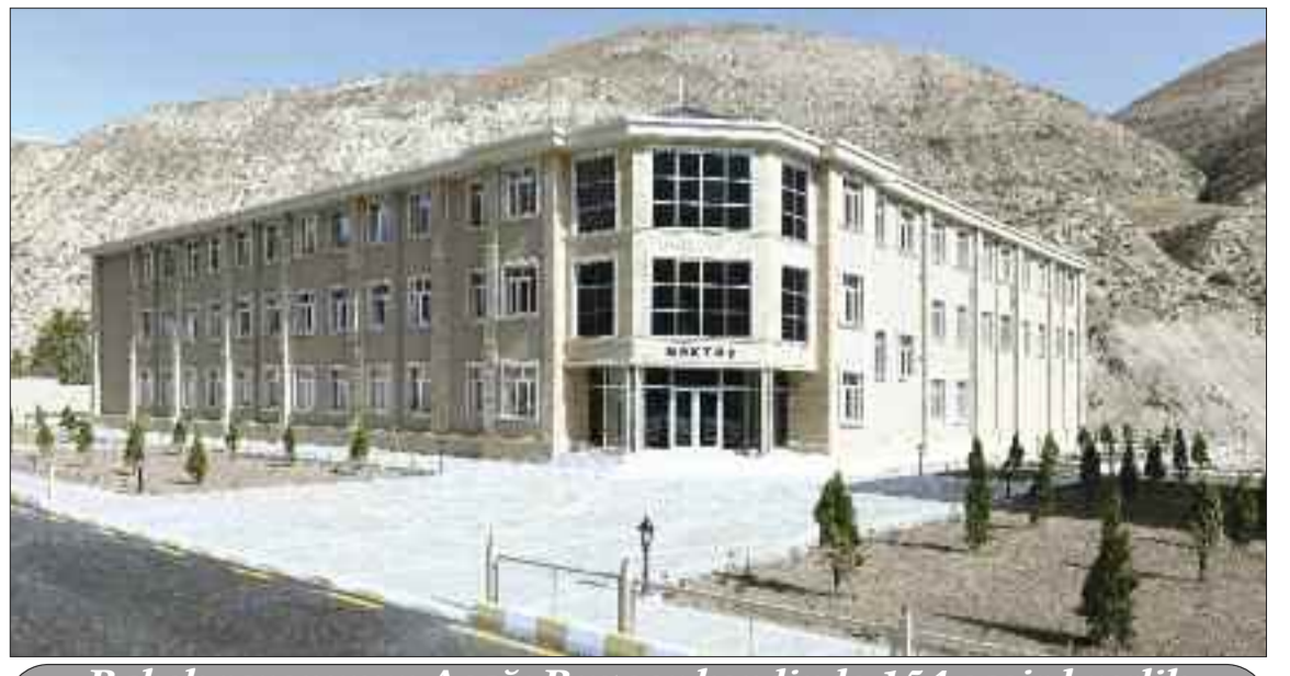
Babək rayonunun Aşağı Buzqov kəndində 154 şagird yerlik tam orta məktəb