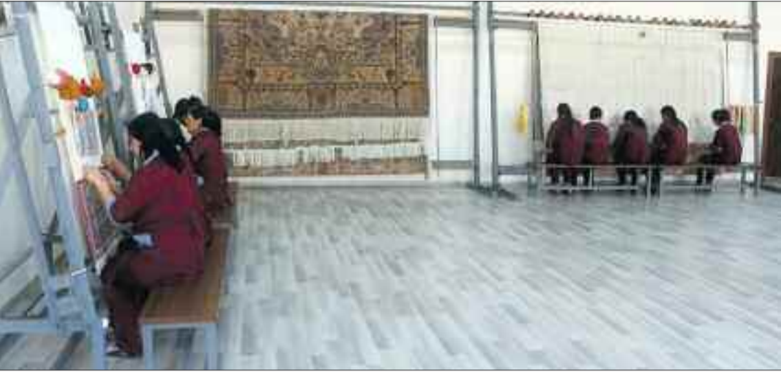
Sədərək rayonunda xalça sexində iş prosesi