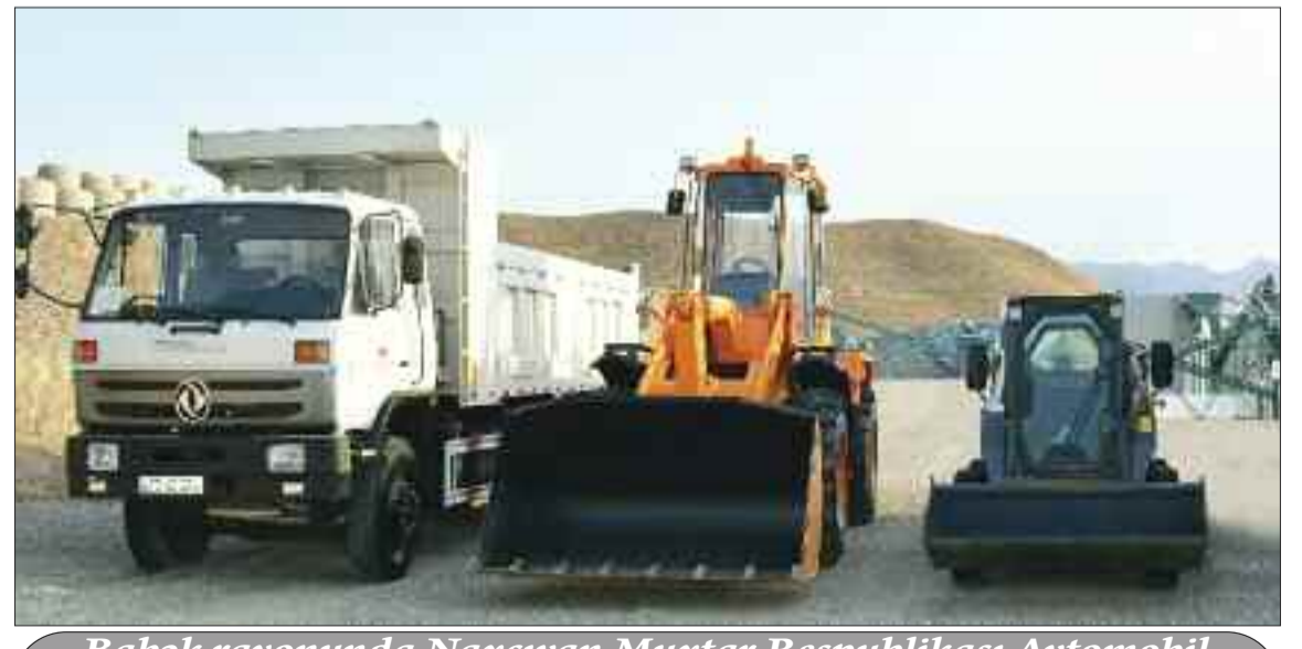
Babək rayonunda Naxçıvan Muxtar Respublikası Avtomobil Yolları Dövlət Agentliyinin yeni Asfalt-Beton Zavod Kompleksinə verilmiş texnikalar