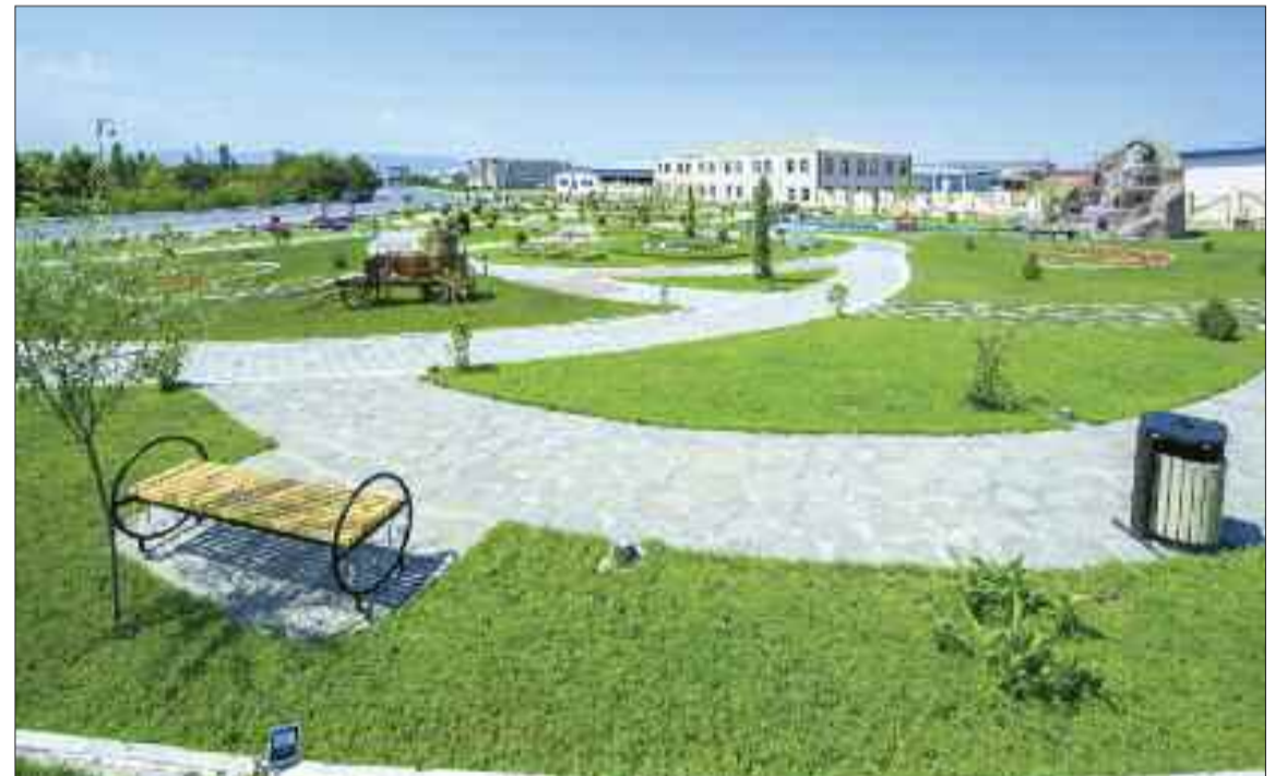
Naxçıvan hərbi şəhərciyində istirahət parkı