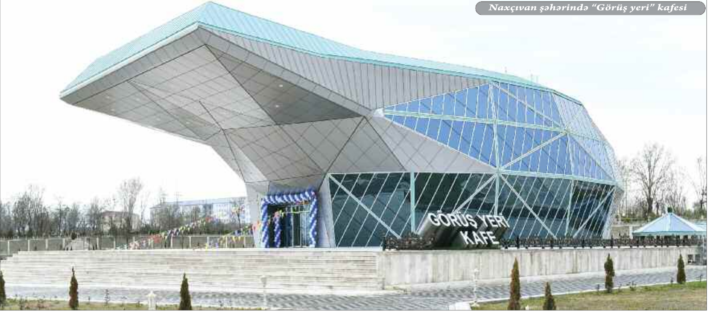
Naxçıvan şəhərində "Görüş yeri" kafesi