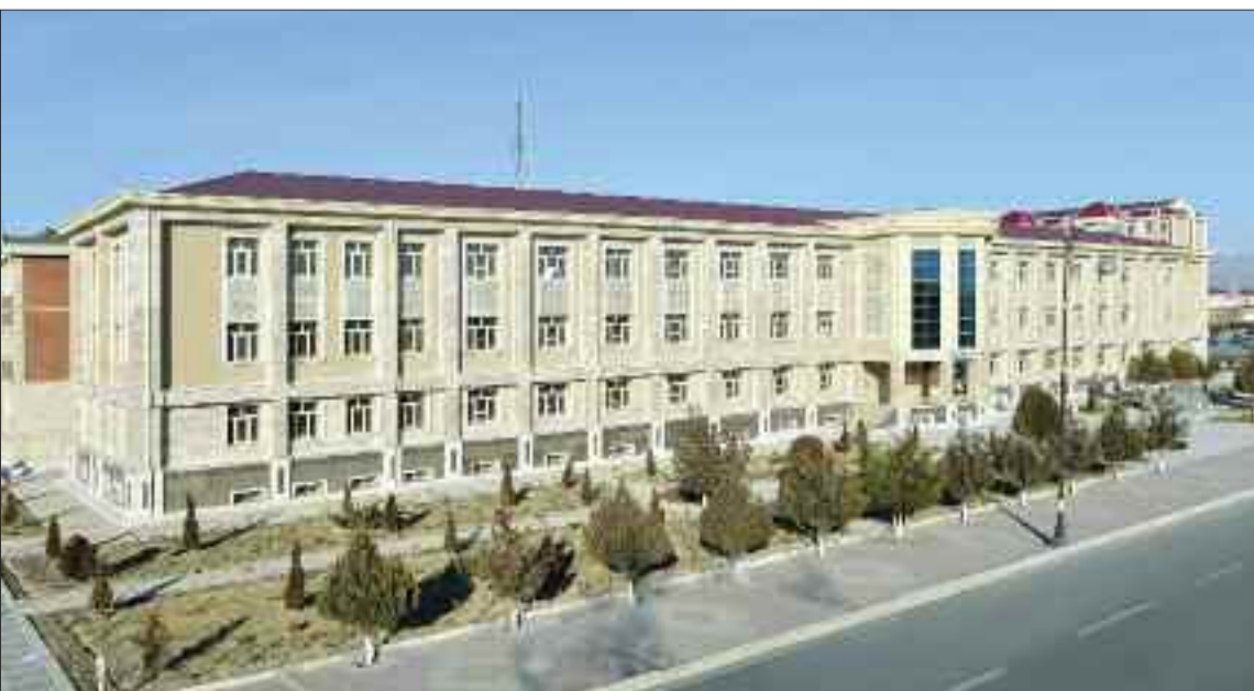
Əziz Əliyev adına Naxçivan Muxtar Respublikası Mərkəzi Uşaq Xəstəxanası