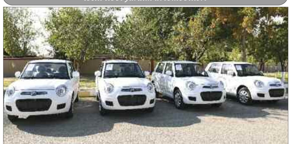
Muxtar respublikanın dini icmalarına verilmiş xidməti avtomobillər