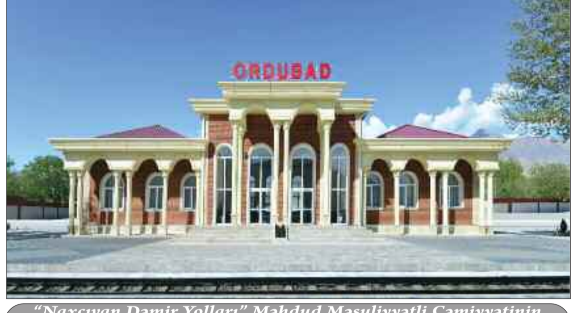
"Naxçıvan Dəmir Yolları" Məhdud Məsuliyyətli Cəmiyyətinin Ordubad dəmir yolu stansiyası