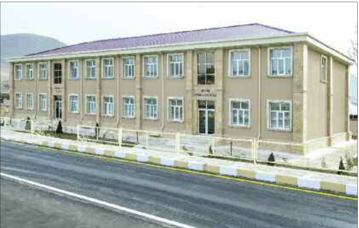
Culfa rayonunun Qazançı kəndində həkim ambulatoriyası