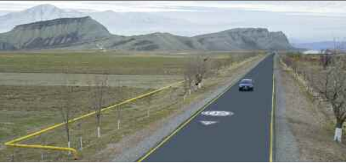
Culfa rayonunun Dizə kəndində avtomobil yolu