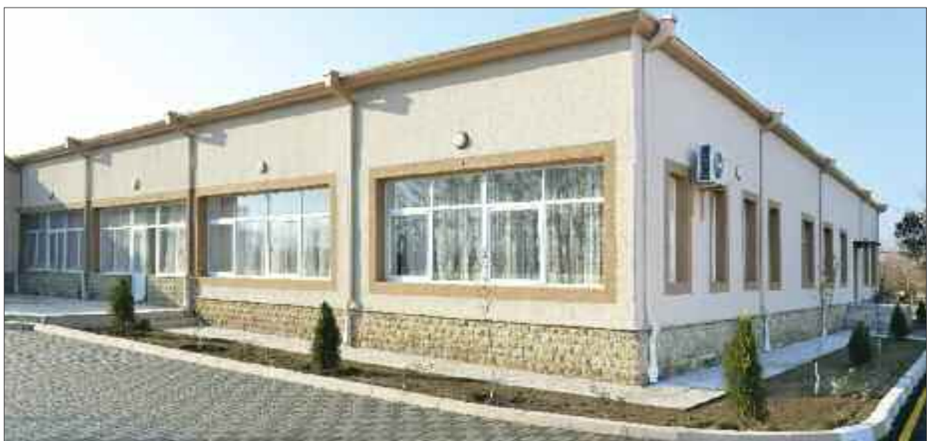
Sədərək rayonunda xalça sexi