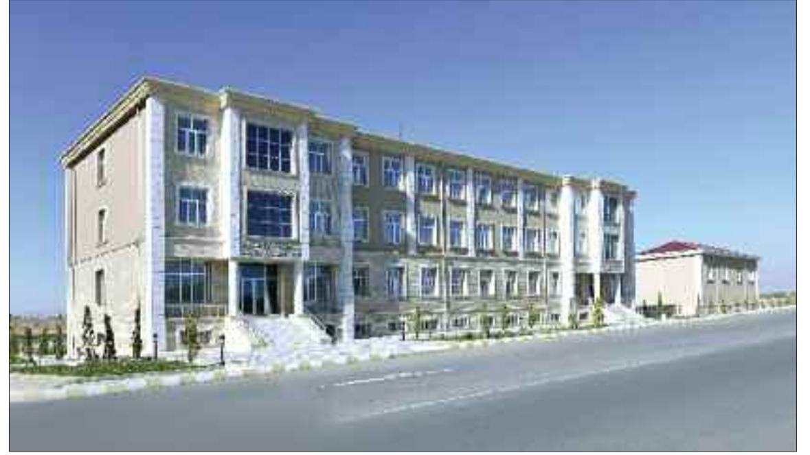
Naxçıvan Muxtar Respublikası Kənd Təsərrüfatı Nazirliyinin Akademik Həsən Əliyev adına "Araz" Elm-İstehsalat Birliyinin, Toxumçuluq və Bitkilərin Mühafizəsi İdarəsinin inzibati binası