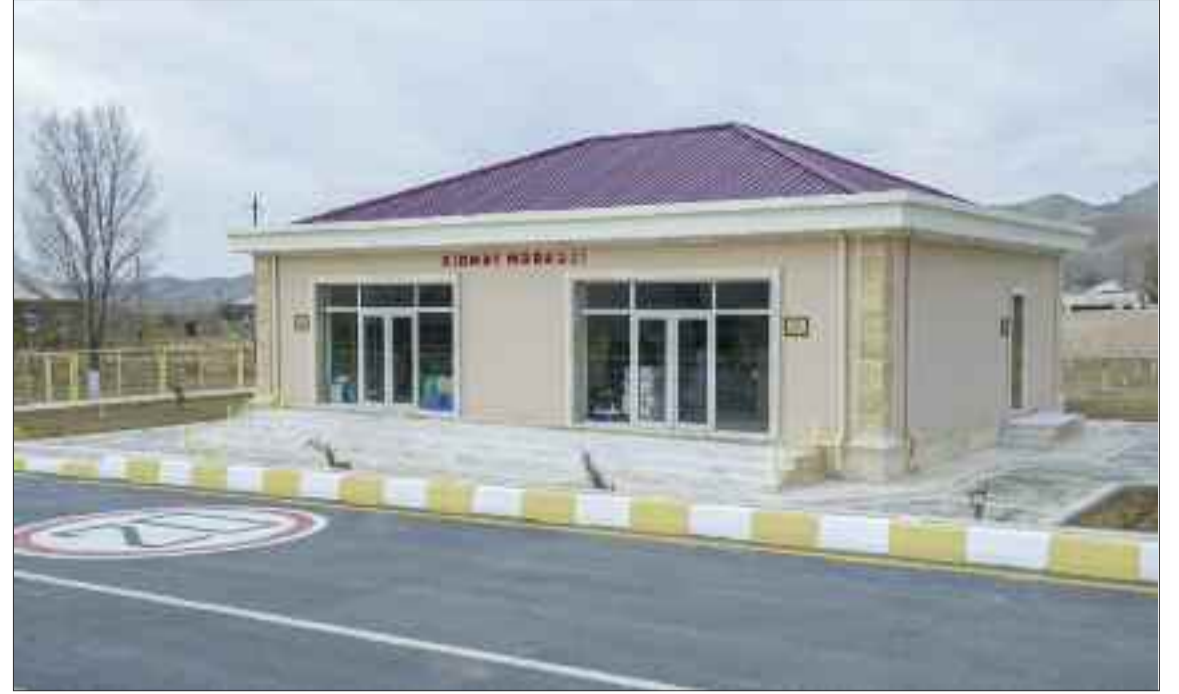
Culfa rayonunun Dizə kəndində xidmət mərkəzi