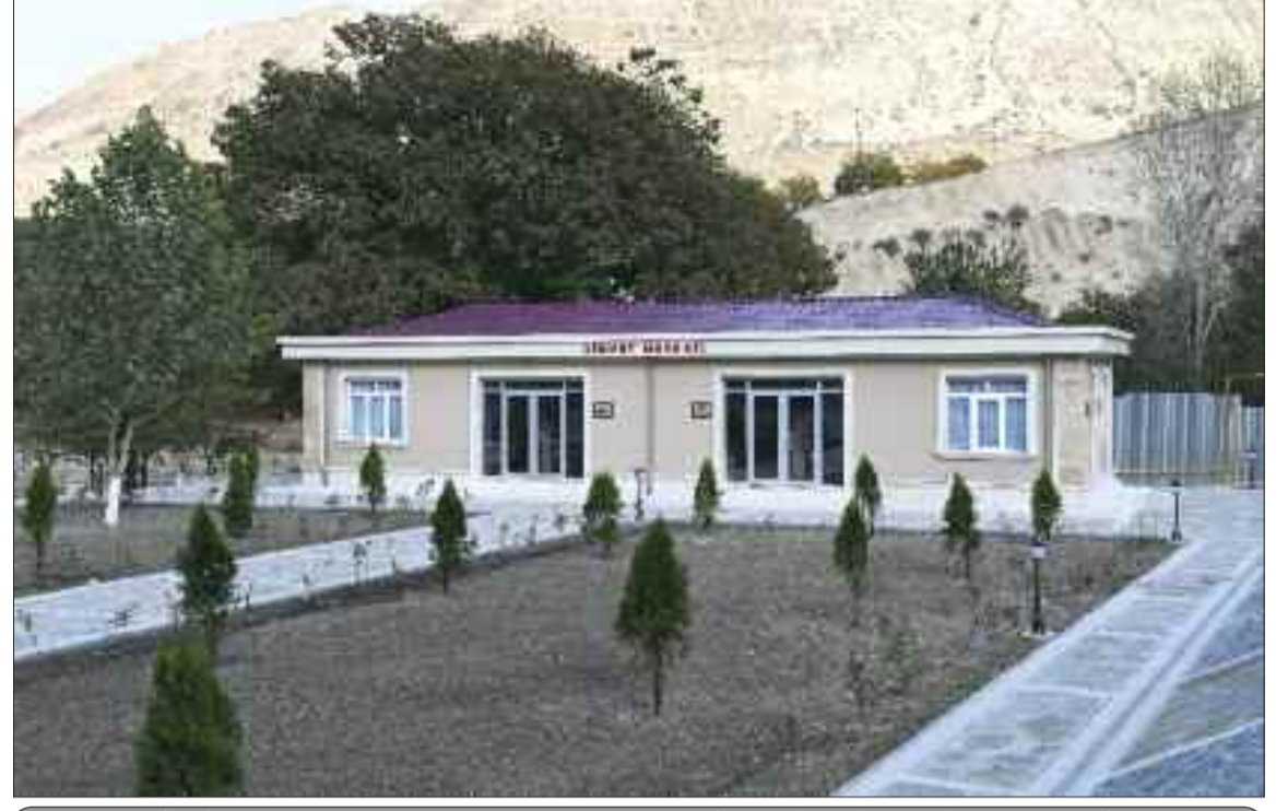
Babək rayonunun Aşağı Buzqov kəndində xidmət mərkəzi