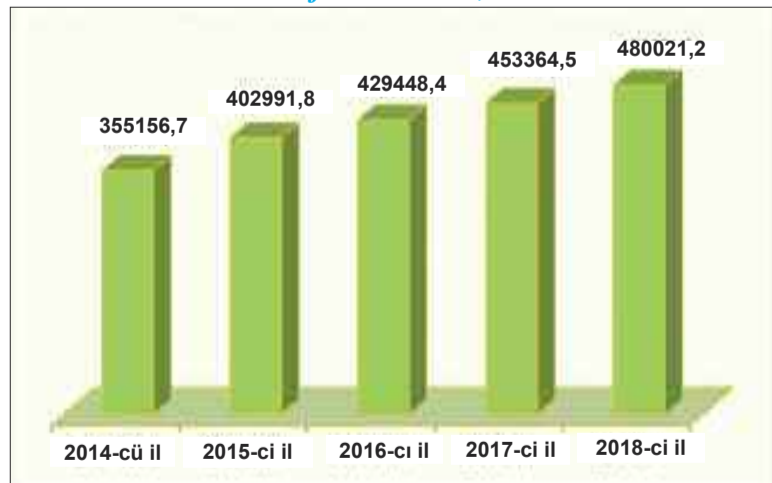
Kənd təsərrüfatı məhsulu, min manat

Etibarlı ərzaq təminatı sisteminin yaradılması ixrac potensialını artırmış, 2018-ci ildə muxtar respublikadan 101 milyon 781 min 300 ABŞ dolları dəyərində kənd təsərrüfatı, o cümlədən meyvə və tərəvəz məhsulları ixrac olunmuşdur.