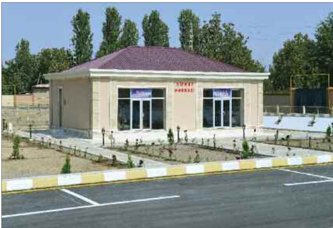
Şərur rayonunun İbadulla kəndində xidmət mərkəzi