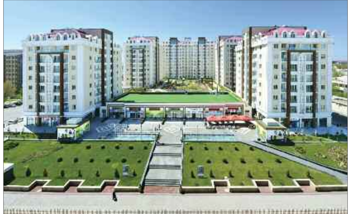
Naxçıvan şəhərinin Əziz Əliyev küçəsində "Gənclər şəhərciyi" yaşayış kompleksi