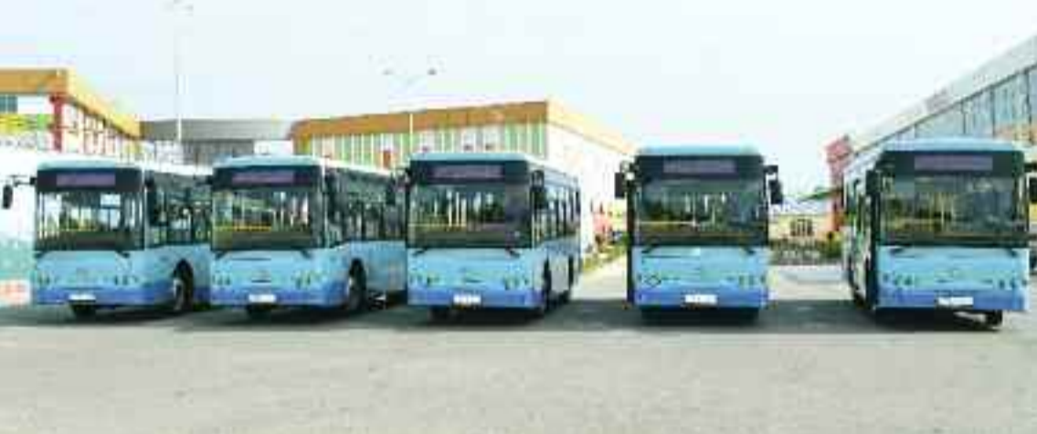
Naxçıvan Şəhər Nəqliyyat İdarəsinə gətirilmiş yeni avtobuslar