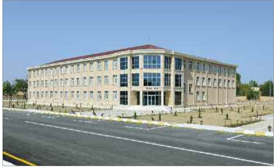
Şərur rayonunun İbadulla kəndində 522 şagird yerlik tam orta məktəb