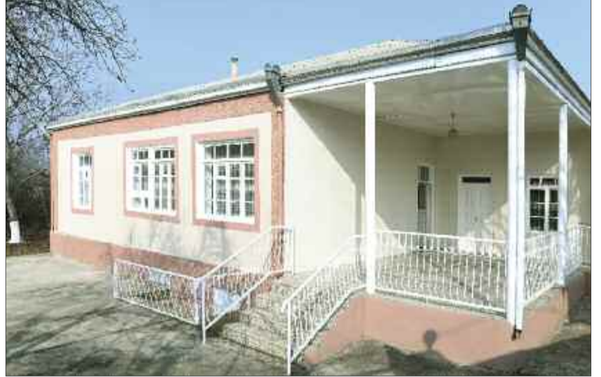
Şərur rayonunda sosial qayğıya ehtiyacı olan şəxsə verilmiş mənzil