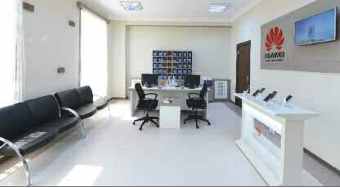
Ordubad rayonunda Yeni Nəsil Telekommunikasiya Sistemi