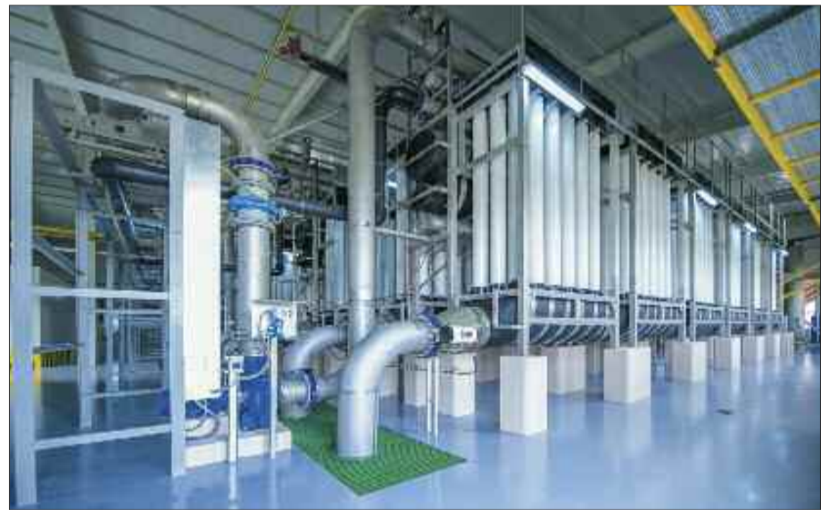
Naxçivan şəhər Təmizləyici Qurğular Kompleksi