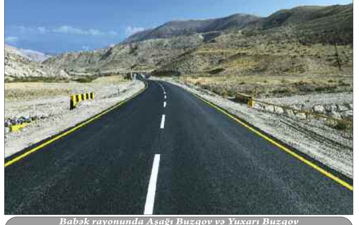
Babək rayonunda Aşağı Buzqov və Yuxarı Buzqov kənd avtomobil yolu