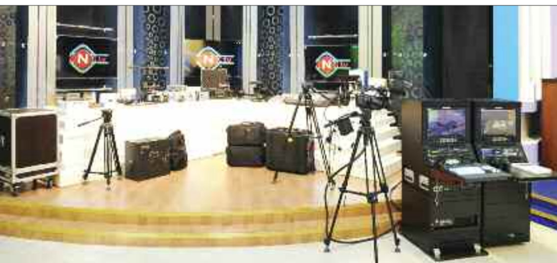
Naxçıvan teleradiosuna verilmiş yeni çəkiliş və efir avadanlıqları