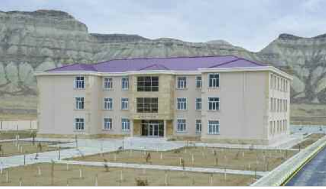
Culfa rayonunun Dizə kəndində 234 şagird yerlik tam orta məktəb