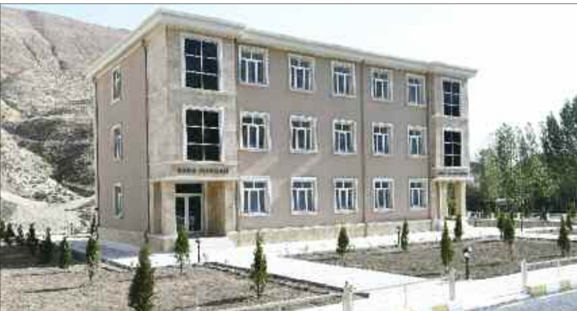
Babək rayonu Aşağı Buzqov Kənd Mərkəzi