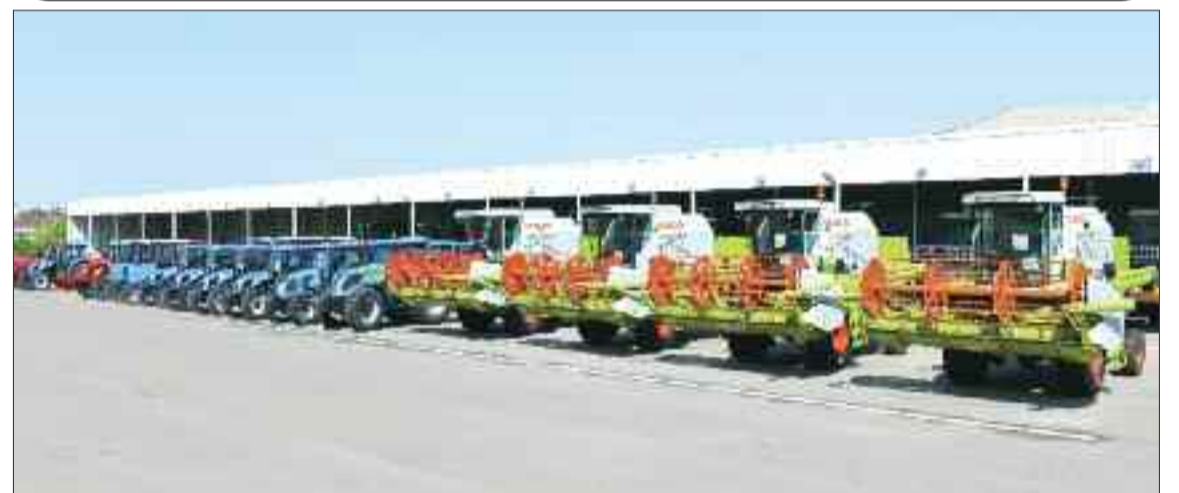
Naxçıvan Muxtar Respublikasına gətirilmiş kənd təsərrüfatı texnikaları