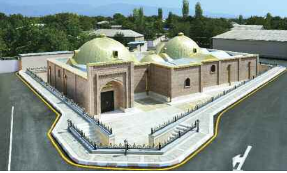
Şərur rayonunun Yengicə kəndindəki Şərq hamamı