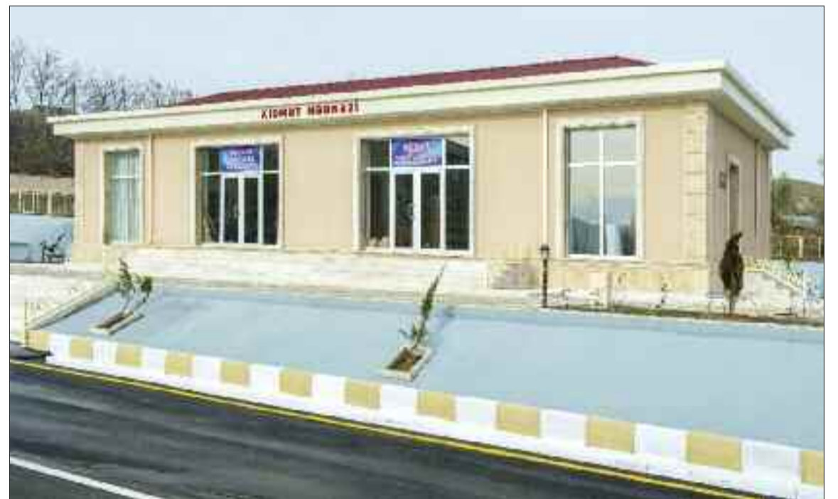
Culfa rayonunun Qazançı kəndində xidmət mərkəzi