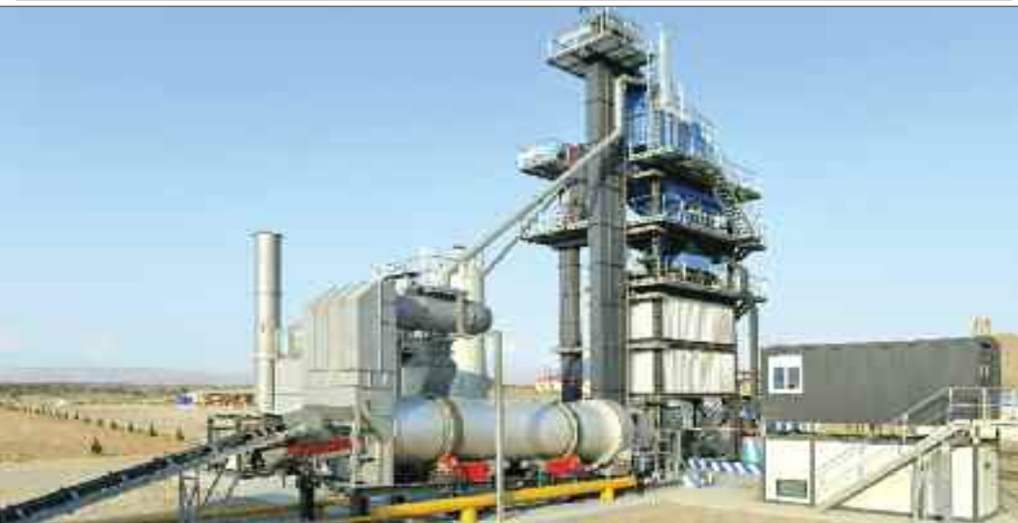
Babək rayonunda Naxçıvan Muxtar Respublikası Avtomobil Yolları Dövlət Agentliyinin yeni Asfalt-Beton Zavod Kompleksi