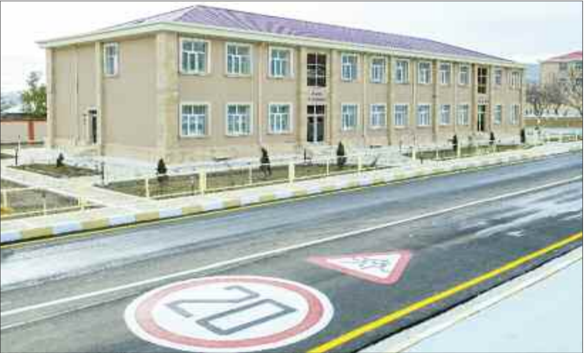
Culfa rayonu Qazançı Kənd Mərkəzi