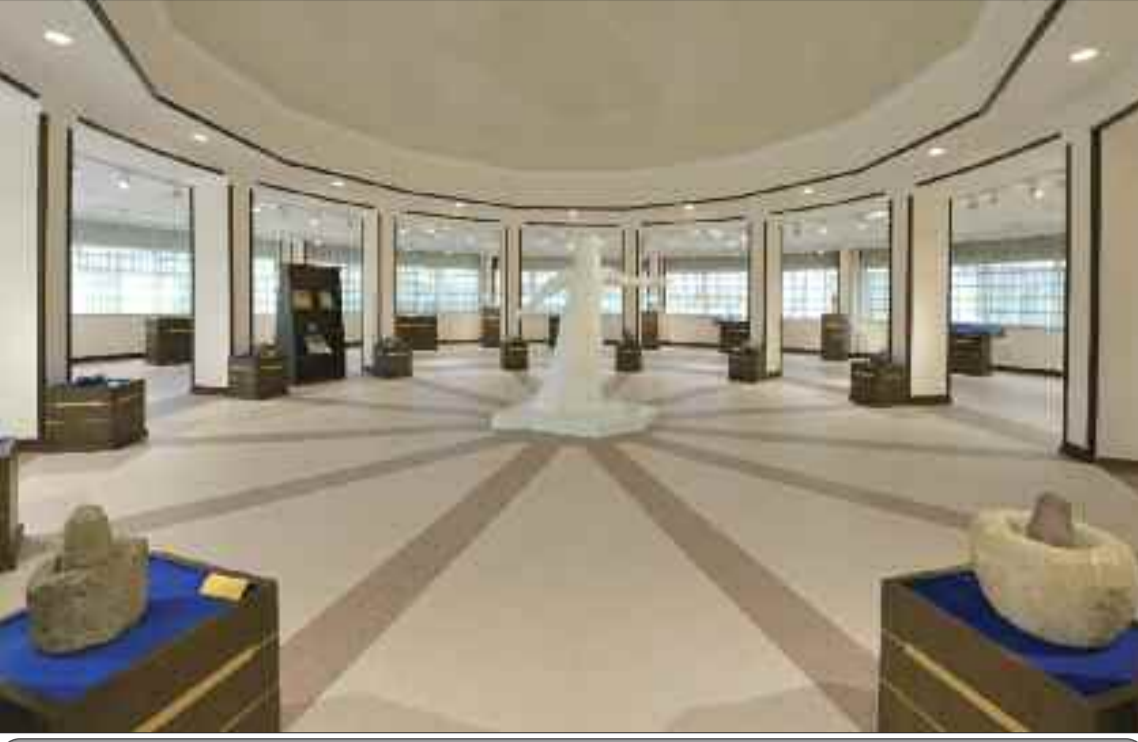
Naxçıvan Duz Muzeyi