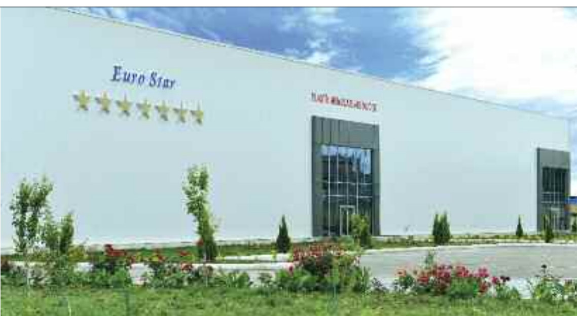
Naxçıvan şəhərində "Cahan Sənaye Kompleksi" Məhdud Məsuliyyətli Cəmiyyətinin plastik boru, profil və aksesuarların istehsalı müəssisəsi