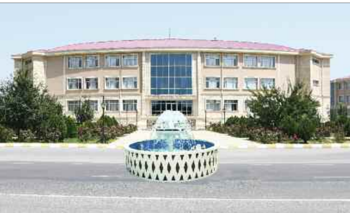
Şərur şəhər və ətraf kəndlərinin içməli su təchizatı və kanalizasiya sistemlərinin birinci mərhələsi