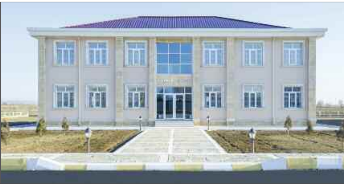
Şərur rayonu Ərəbyengicə Kənd Mərkəzi