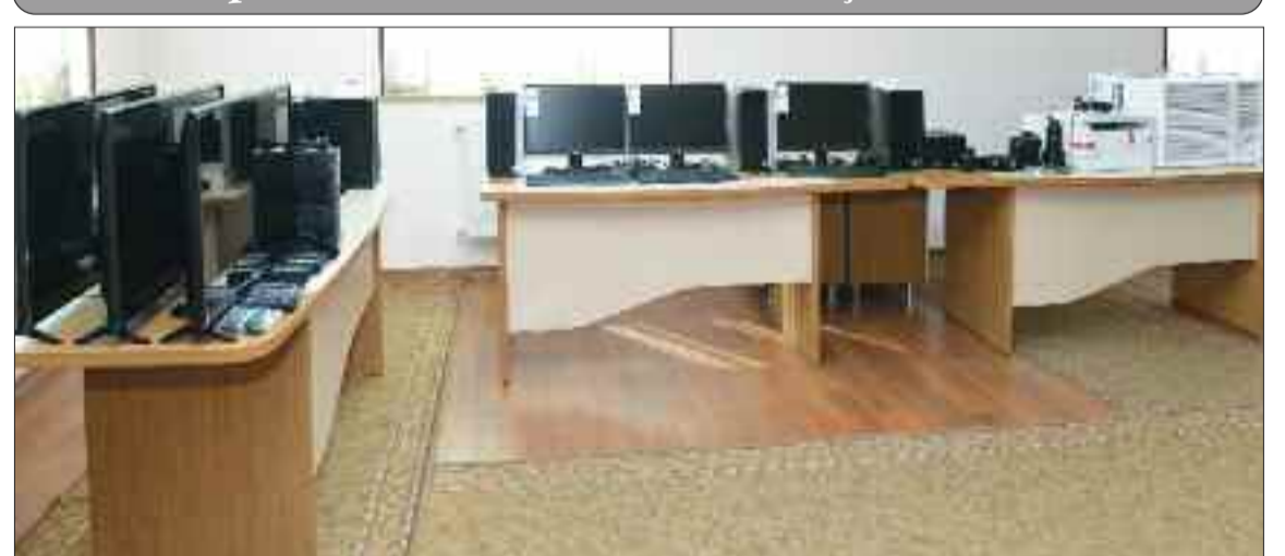
Naxçıvan Muxtar Respublikasının kütləvi informasiya vasitələrinə verilmiş yeni avadanlıqlar