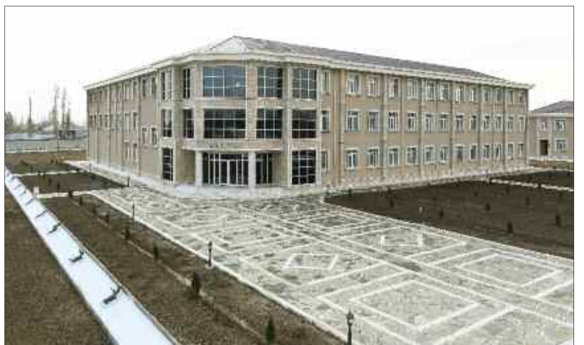
Şərur rayonunun Kosacan kəndində 234 şagird yerlik tam orta məktəb