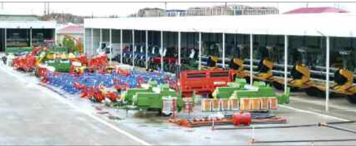
Naxçıvan Muxtar Respublikasına gətirilmiş kənd təsərrüfatı texnikaları