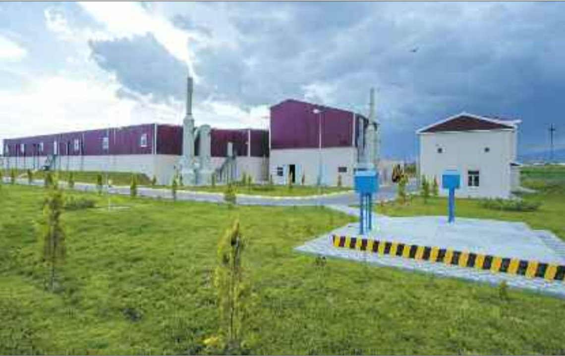
Naxçivan şəhər Təmizləyici Qurğular Kompleksi