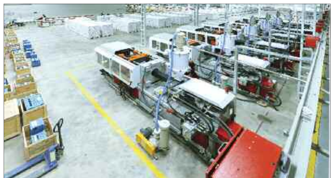
Naxçıvan şəhərində "Cahan Sənaye Kompleksi" Məhdud Məsuliyyətli Cəmiyyətinin plastik boru, profil və aksesuarların istehsalı müəssisəsi