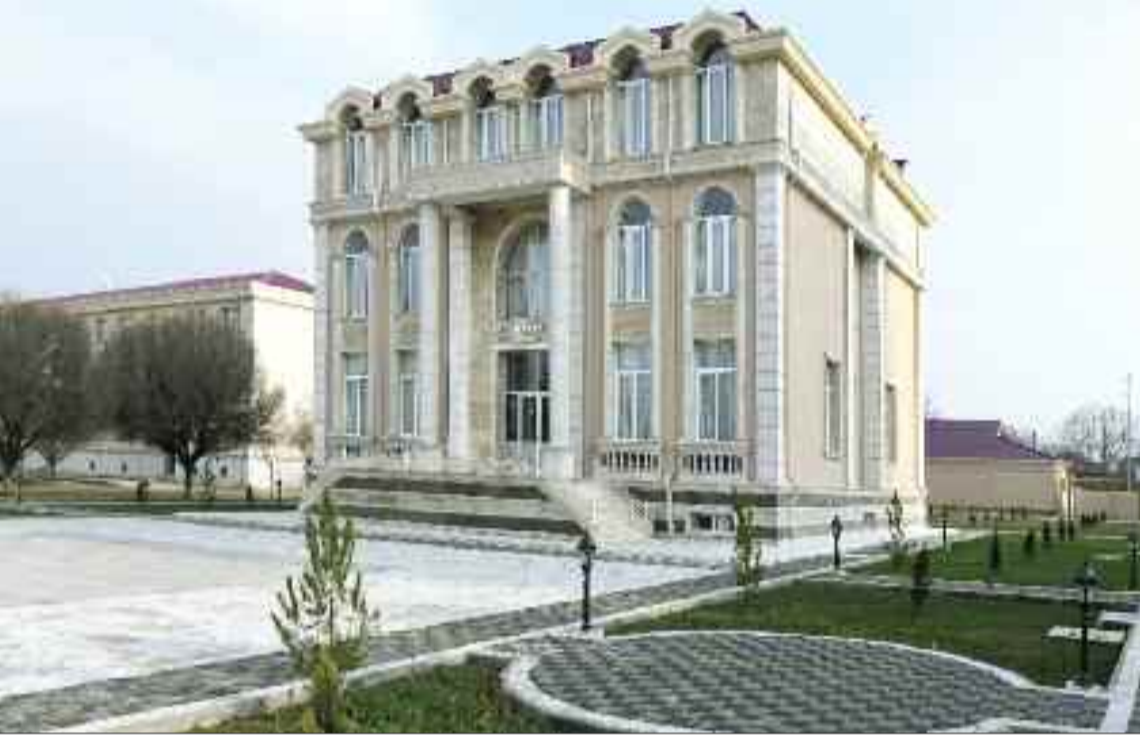
Şərur Rayon Tarix-Diyarşünaslıq Muzeyi