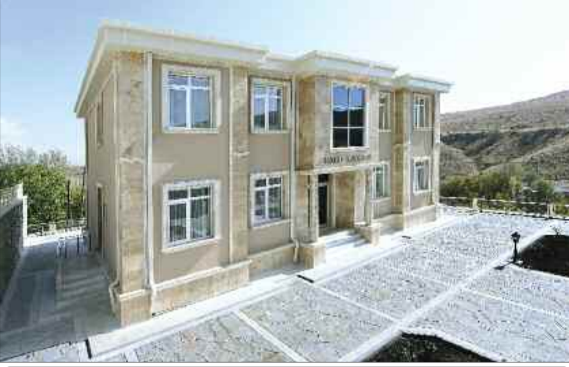
Babək rayonu Yuxarı Buzqov Kənd Mərkəzi