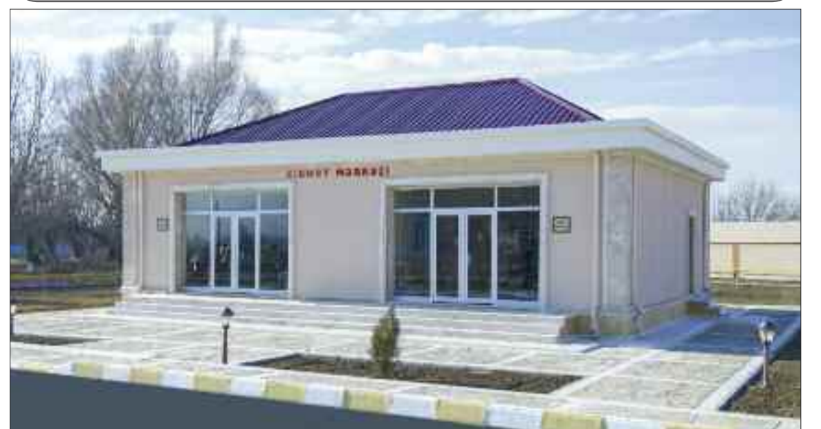
Şərur rayonunun Ərəbyengicə kəndində xidmət mərkəzi