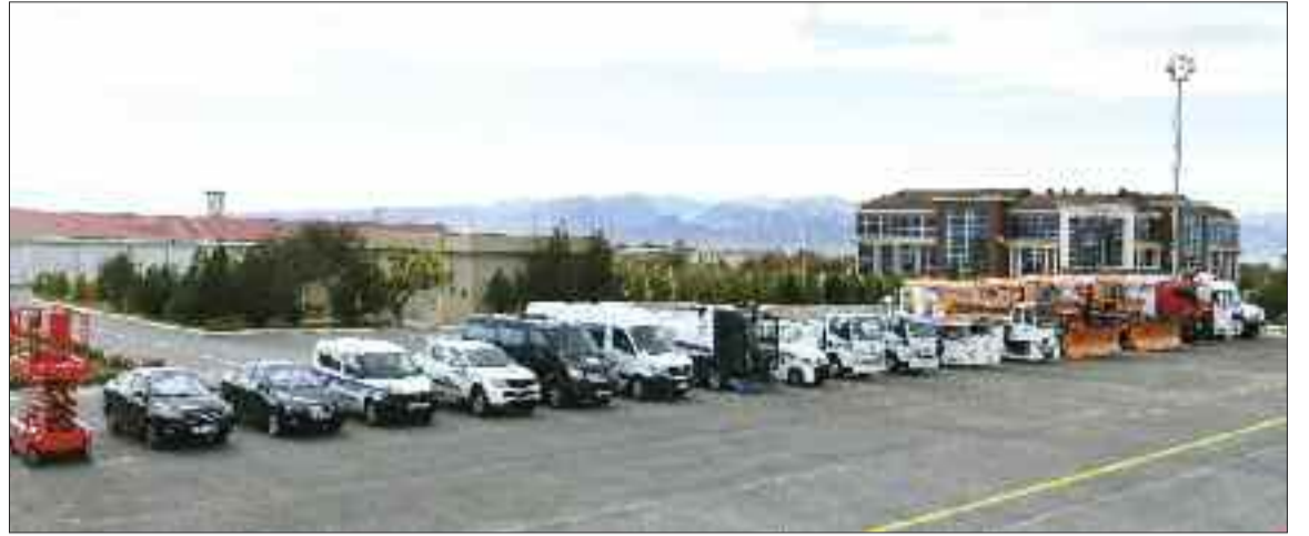
Naxçıvan Beynəlxalq Hava Limanına gətirilmiş yeni maşın-mexanizmlər və xidməti avtomobillər