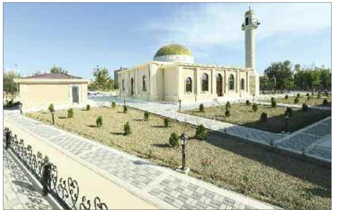
Babək rayonunun Babək qəsəbəsində məscid və mərasim evi