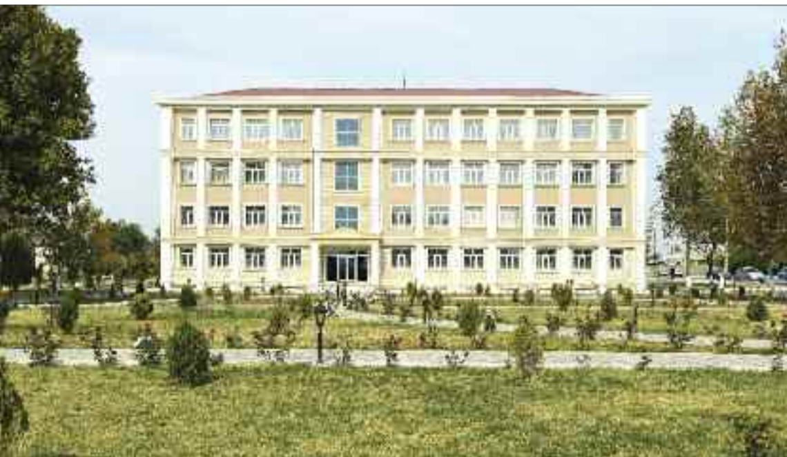
Babək rayonunun Babək qəsəbəsində dövlət qurumları və ictimai təşkilatlar üçün inzibati bina