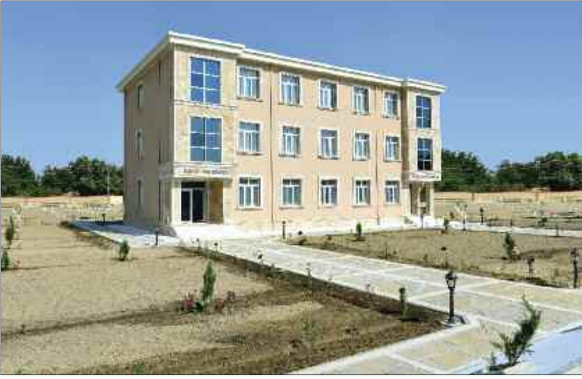
Şərur rayonu İbadulla Kənd Mərkəzi