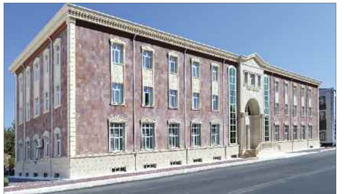
Naxçivan Tibb Kolleci