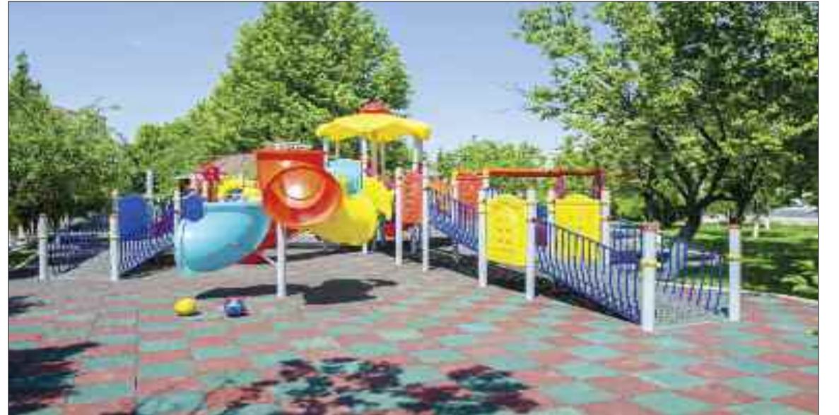
Naxçıvan şəhərində sağlamlıq imkanları məhdud uşaqlar üçün uyğunlaşdırılmış əyləncəli oyun sahəsi