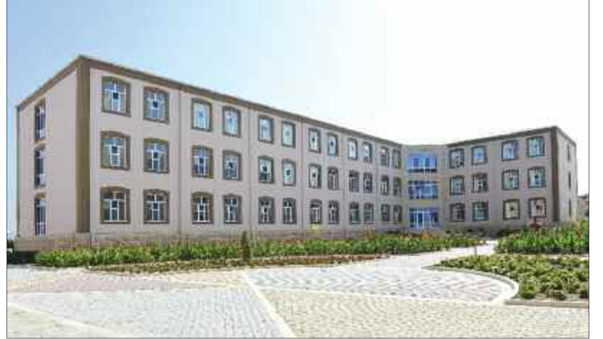
Əlahiddə Ümumqoşun Ordunun "N" hərbi hissəsində xəstəxana