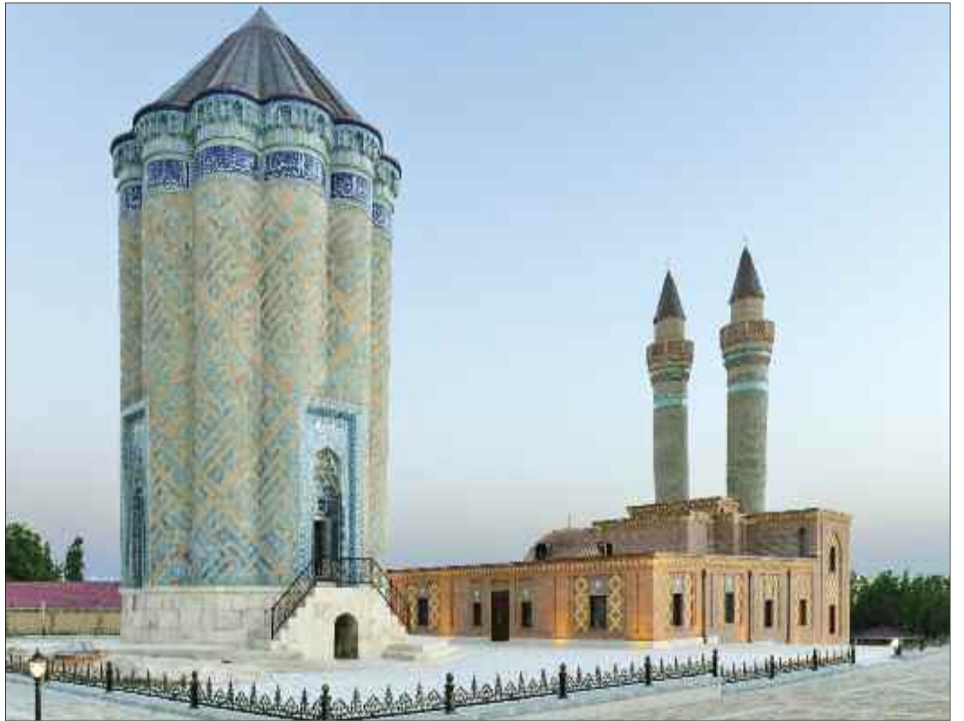
Kəngərli rayonunda Qarabağlar Türbə Kompleksi