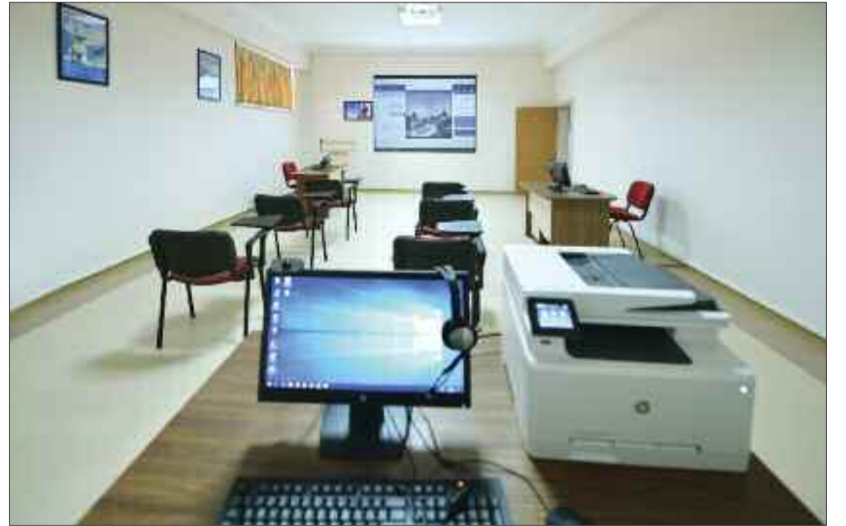
Naxçivan Dövlət Universitetinin Distant Təhsil Mərkəzi