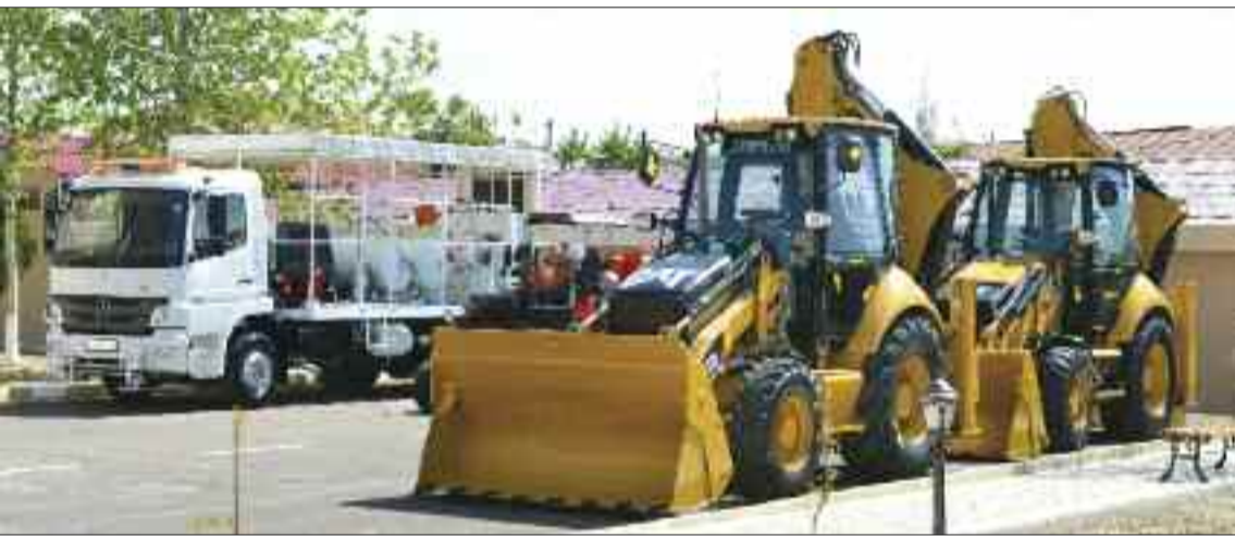
Naxçıvan Muxtar Respublikası Avtomobil Yolları Dövlət Agentliyinə verilmiş yeni texnikalar