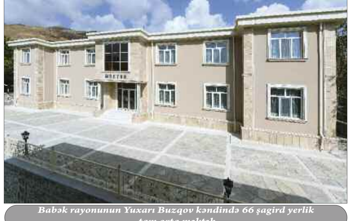
Babək rayonunun Yuxarı Buzqov kəndində 66 şagird yerlik tam orta məktəb