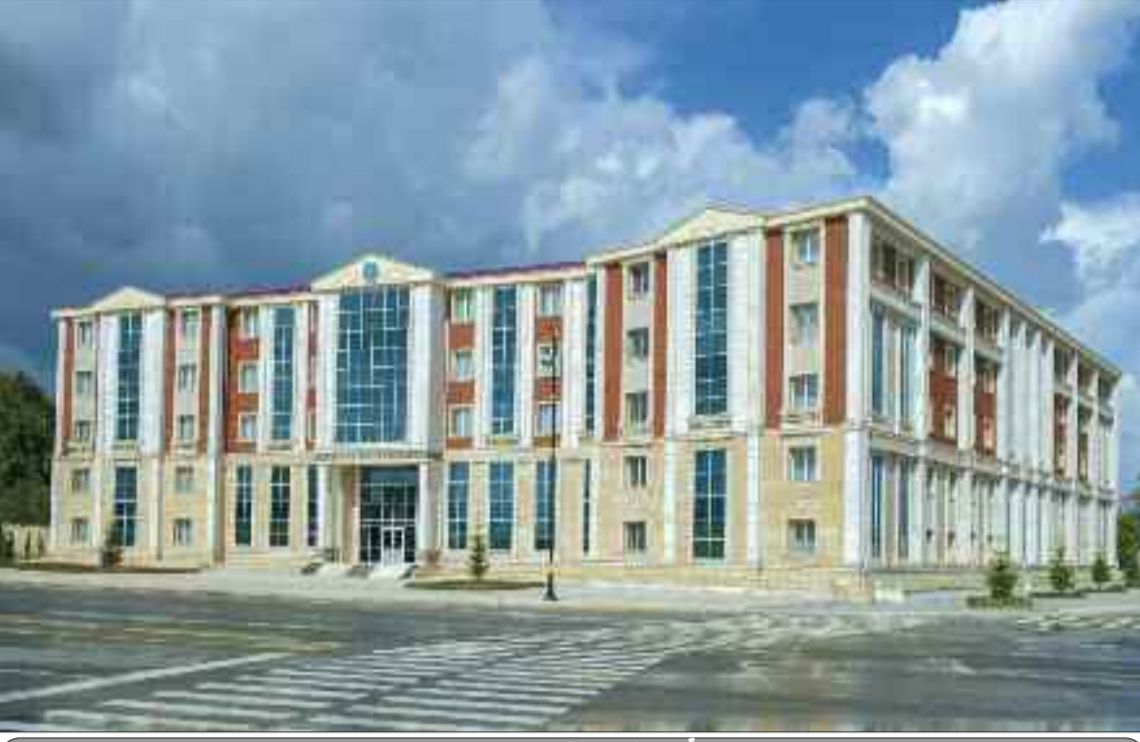
Naxçivan Müəllimlər İnstitutu