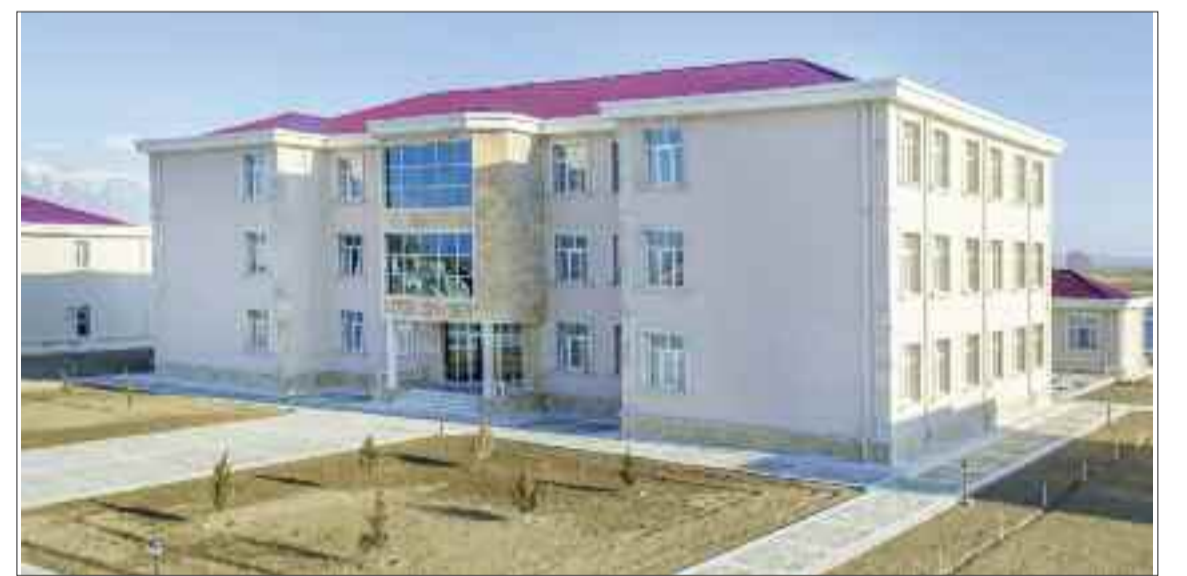
Şərur rayonunun Ərəbyengicə kəndində 208 şagird yerlik tam orta məktəb