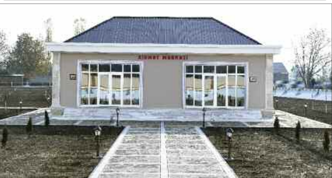
Şərur rayonunun Kosacan kəndində xidmət mərkəzi