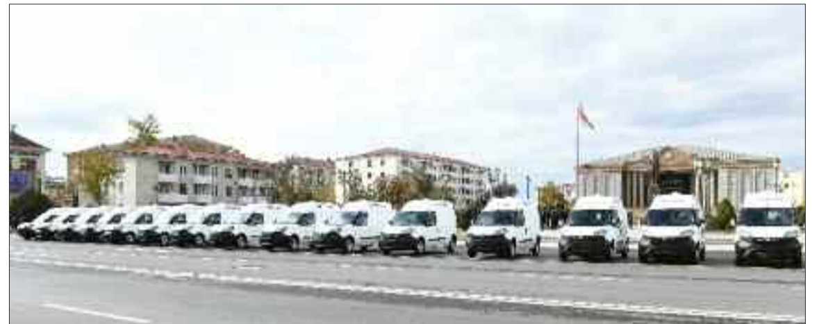
Naxçıvan Muxtar Respublikasının səhiyyə müəssisələrinə gətirilmiş təcili tibbi yardım avtomobilləri