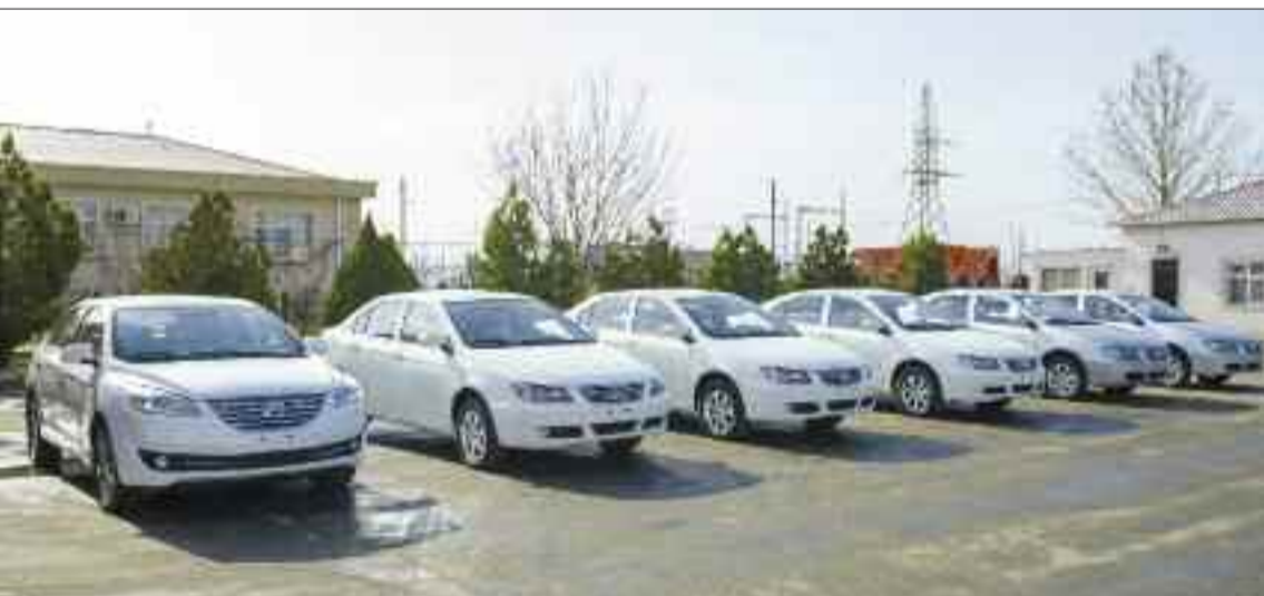
Naxçıvan Muxtar Respublikasında dövlət qurumlarına verilmiş yeni avtomobillər