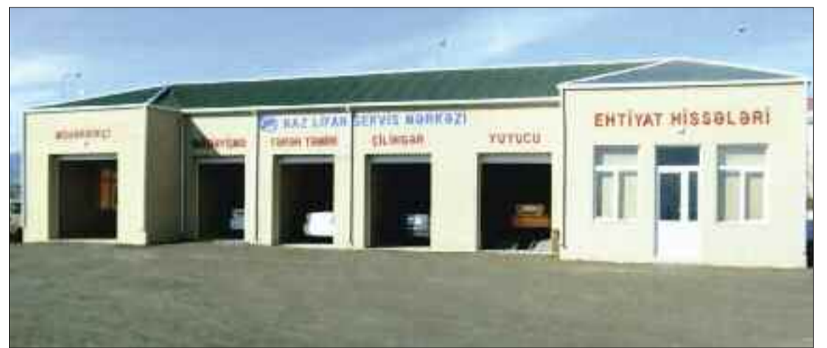
Culfa rayonunda "Naxçıvan Avtomobil Zavodu" Məhdud Məsuliyyətli Cəmiyyətinin texniki xidmət bölmələri və avtomobil ehtiyat hissələrinin satışı mağazası