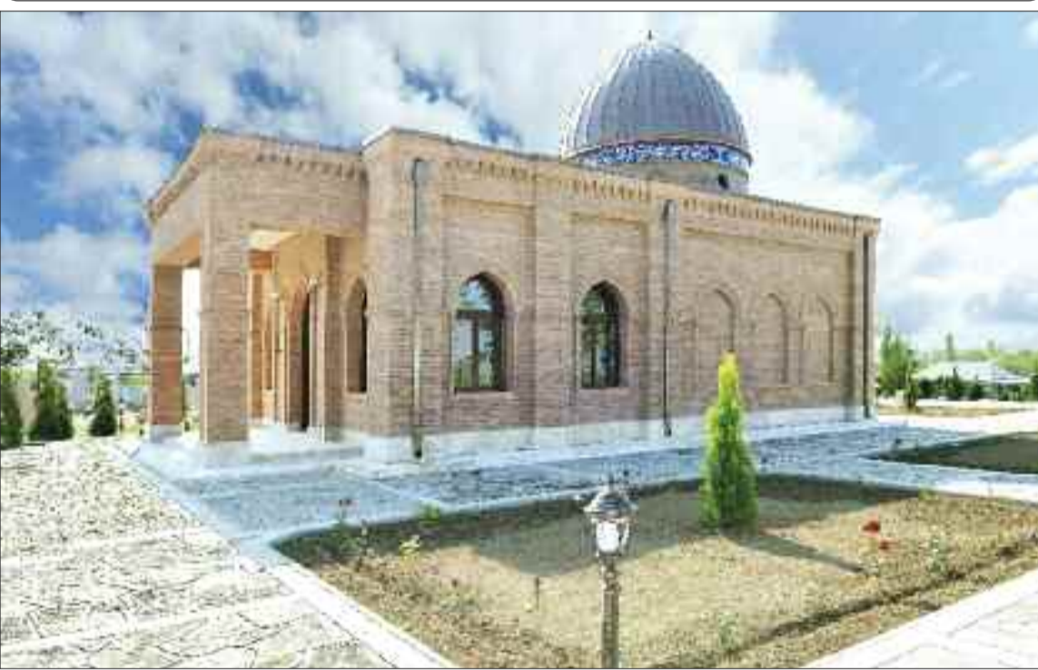
Babək rayonunda Nəhrəm İmamzadəsi