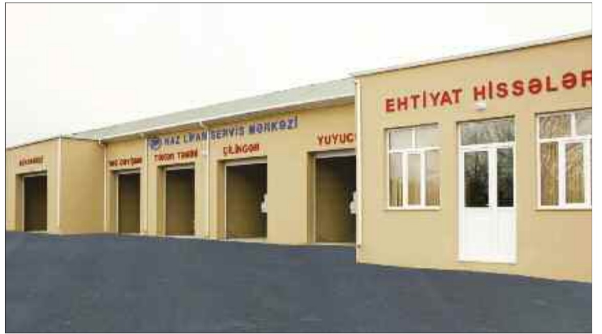
Şərur rayonunda "Naxçıvan Avtomobil Zavodu" Məhdud Məsuliyyətli Cəmiyyətinin texniki xidmət bölmələri və avtomobil ehtiyat hissələrinin satışı mağazası