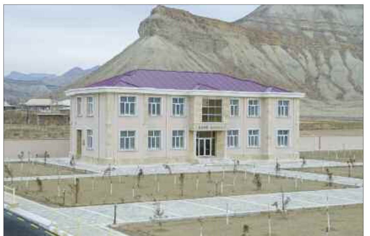
Culfa rayonu Dizə Kənd Mərkəzi