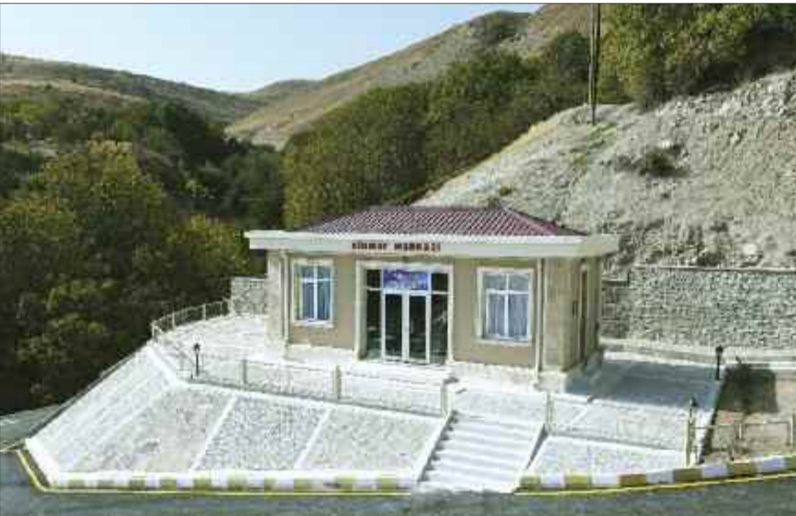
Babək rayonunun Yuxarı Buzqov kəndində xidmət mərkəzi