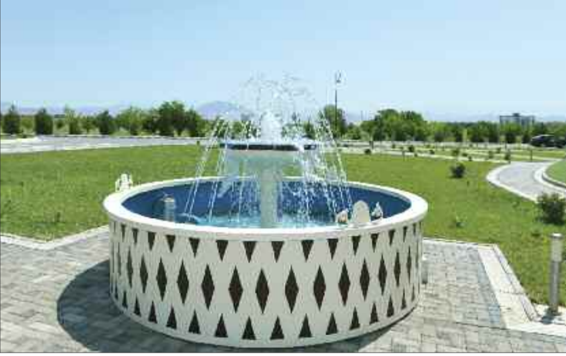
Babək rayonunun Şəkərabad kəndində içməli su və kanalizasiya şəbəkəsi