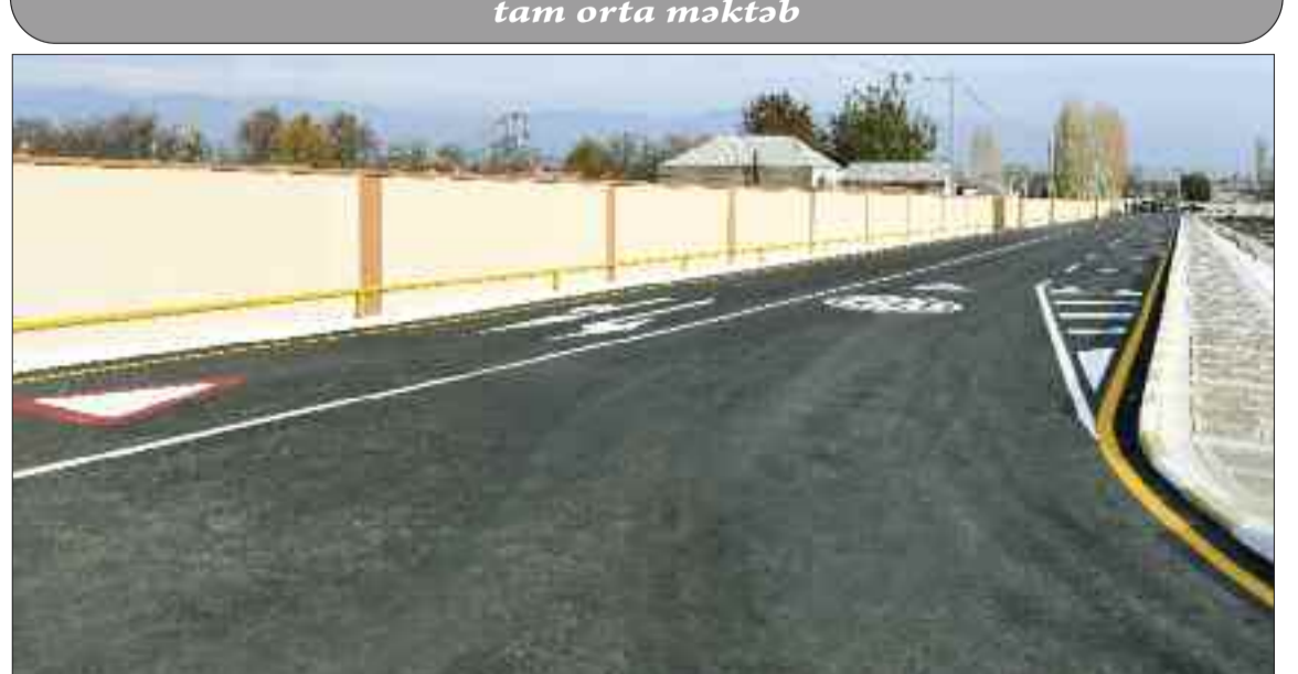
Şərur rayonunda Kosacan kənd avtomobil yolu