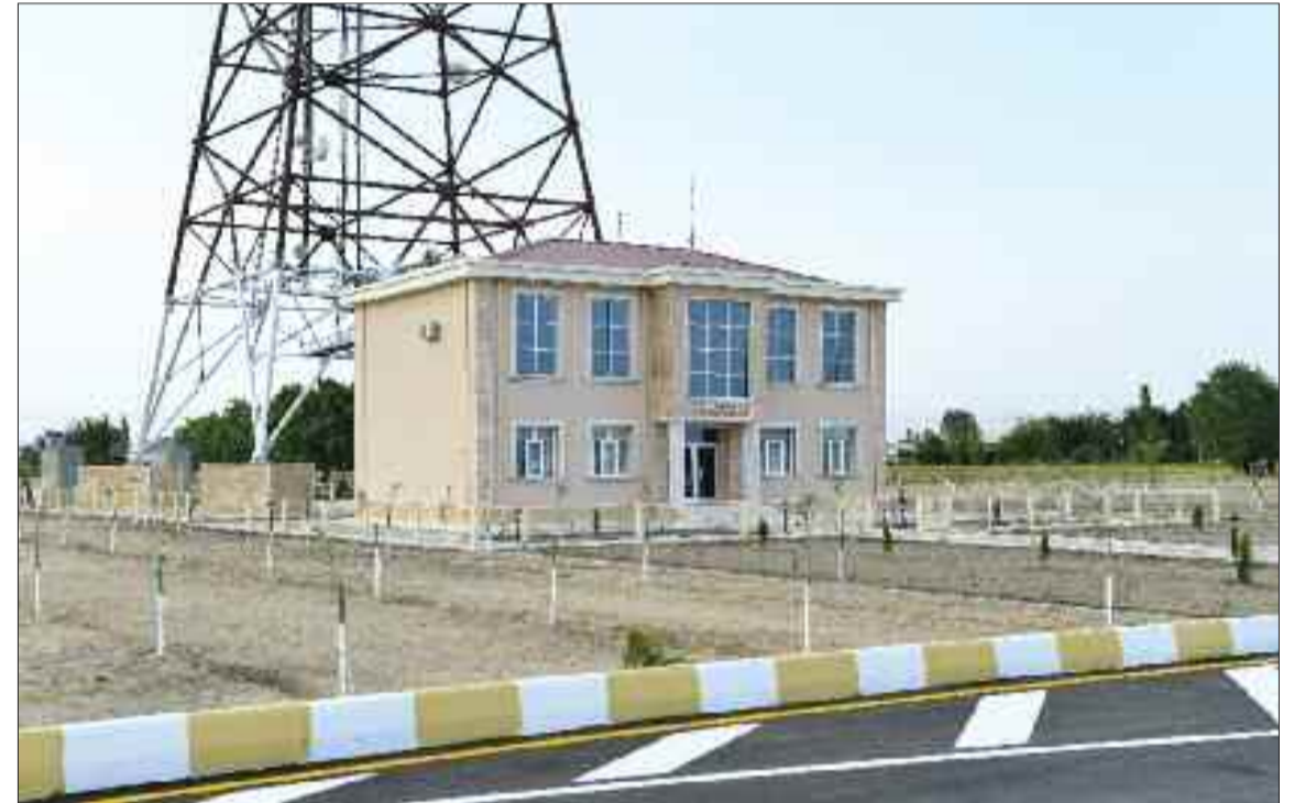
Şərur rayonunda İbadulla Radio-Televiziya Verici Stansiyası