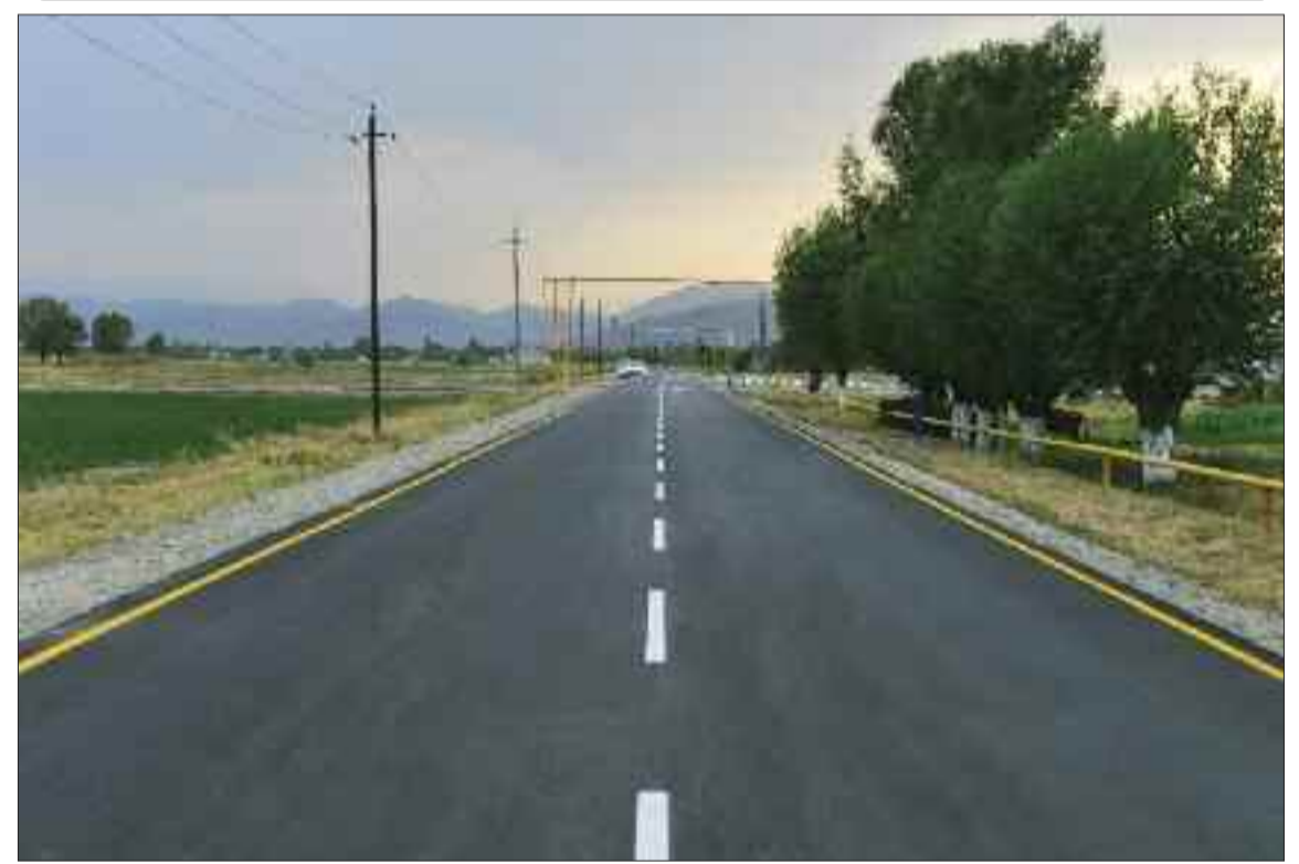
Şərur rayonunda İbadulla-Qışlaqabbas kənd avtomobil yolu