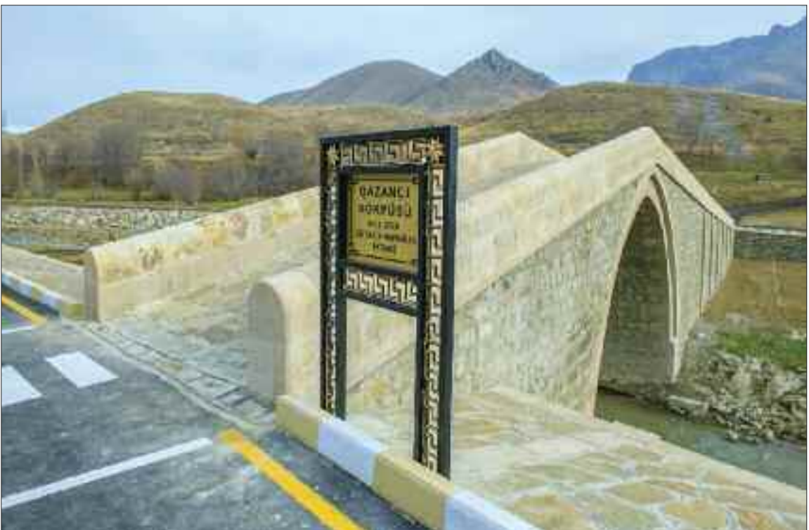
Culfa rayonunda Qazançı körpüsü tarixi-memarlıq abidəsi