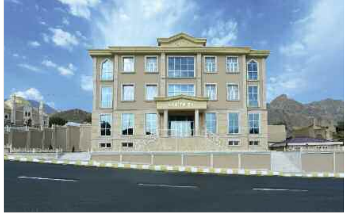
Ordubad rayonunda Rabitə Evi