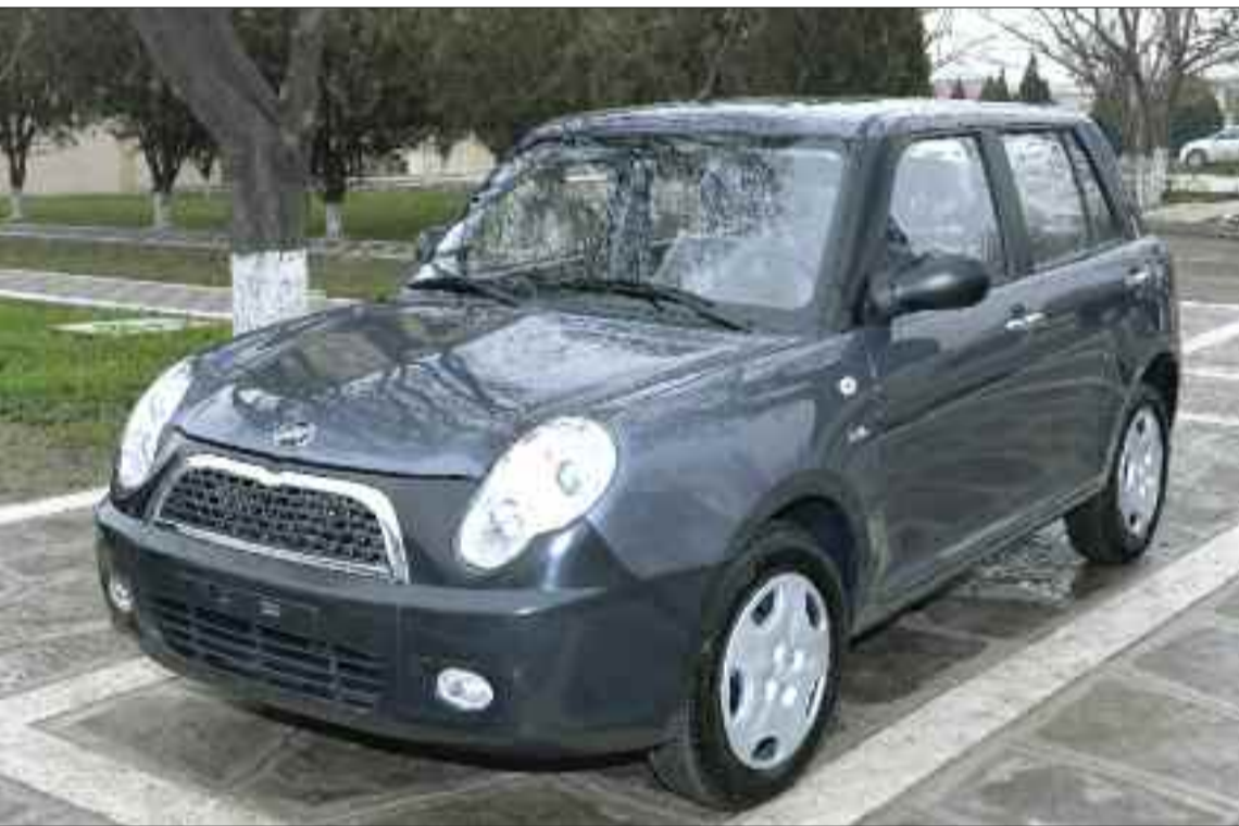
Şərur rayonunda sosial qayğıya ehtiyacı olan şəxsə verilmiş minik avtomobili